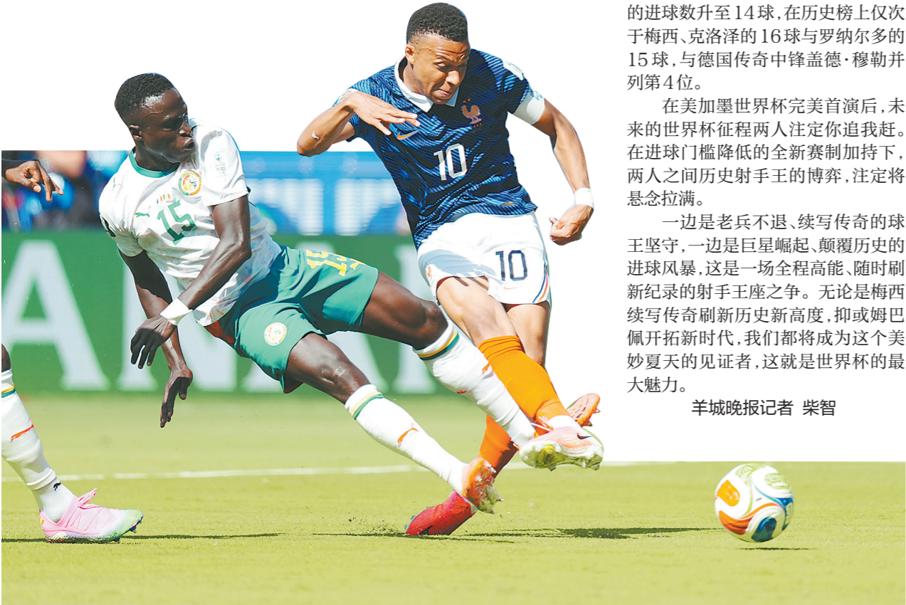
北京时间6月17日，法国队3比1战胜塞内加尔队，法国队球员姆巴佩(右)在比赛中射门