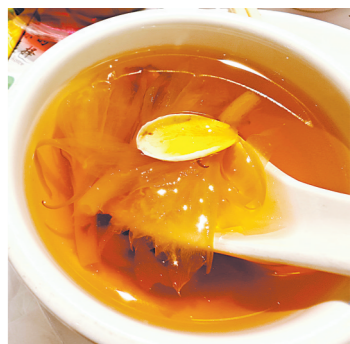
仙荔庆团圆汤水清润

每逢荔枝上市,广州不少餐厅都会推出红云宴。红云宴源于广州,出自番禺。宋代顾文荐《负隐杂录·荔枝》记载,五代十国时期,占据岭南番禺的南汉后主刘鋹每逢荔枝熟时节必设红云宴。宴所四周遍植荔枝,鲜果盈窗,远望形如红霞,故以此为名。 踏入21世纪,较早标准化推出红云宴的是番禺宾馆,从2017年开始年年举办红云宴。随后,泮溪酒家、唐荔园也推出相关宴席。近年来,一直致力于推广番禺菜的容太也在市桥的“佬佬餐厅”设置了红云宴,成为大热的选择。这个红云宴借助番禺传统官府菜、家常菜菜谱,结合本土时令河海鲜、蔬果等食材,还以金银荔枝、青榄、鸡蛋花、团鱼(甲鱼别称)地竹丝鸡。用金银荔枝炖汤,量大料足,荔枝的香味可谓贯穿全程。开饭前喝一碗,席间喝一碗,荔枝香彻底融入汤水里。由于汤料搭配得当,喝起来十分清润、舒服。 鱼龙披金甲,即荔枝干豉油糖煎黄花鱼。咸甜口是番禺菜的一大特色,豉油糖煎鱼是传统家常菜,加入荔枝干碎,和着鲜嫩的黄花鱼肉一起吃,荔枝的香甜与之真的很搭。 妃子笑成鱼肉饼蒸水蟹配细米