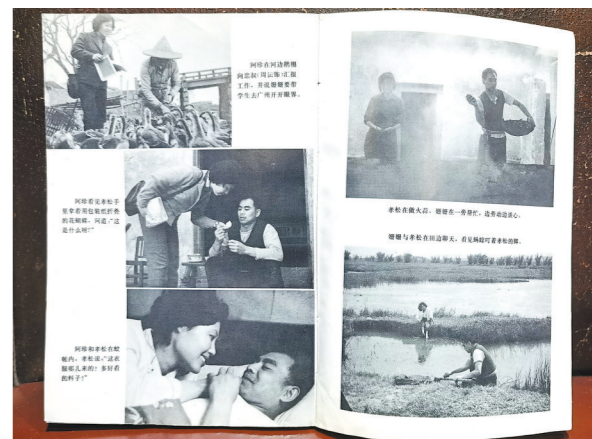
《似水流年》从剧本到影片书影

当大家都在谈《给阿嬷的情书》时,我想谈谈40多年前出现的一部划时代影片:孔良编剧、严浩导演的《似水流年》。熟悉这部影片的观众,现在的年纪应该在60岁至70岁之间,小于或大于这个年龄段的,就算是看过,也可能对它没什么印象,或者有影响而不觉得好到了“划时代”的程度。而喜欢摆弄电影史的人,就算现在不怎么看张艺谋、陈凯歌导演的影片了,也还是会将“第五代导演”的崛起视为中国电影的新纪元。这样说起来,中国电影在20世纪80年代就同时竖起了两块里程碑,一块是“第五代导演”,另一块就是《似水流年》。如果说第五代导演是大刀阔斧地改革了电影的语言——尤其是视觉语言,因而引起了地震般的反应,那么《似水流年》就是凭借作者不露声色的诗情和对时代变化的敏感,让看过影片的人还想再看几遍。如果这些人再分出看热闹的和看门道的,那么看热闹的就是想让自己抓住那种踏入现代化门槛时即将逝去的田园生活,看门道的就是想知道自己究竟是怎样被影片抓住的,难道就是凭影片什么故事也没有讲?这个“没有故事”不是我说的,是郑洞天老师在一篇自问自答的文章中给予的评价,用来形容影片“着意于表现特定生活中矛盾冲突不那么尖锐、分明,而且能够自我消融的形态”。我之所以摘抄这句话,是因为我有《《似水流年》——从剧本到影片》这本书。电影是1984年拍摄的,次年获得了第四届香港电影金像奖六个大奖。我就是那一年在长沙的电影院的银幕上看到了它,1987年又在广州的新华书店买到了中国电影出版社出版的这个本子。郑洞天老师说他连看了三遍,我跟他不同,我是在那之后的十多年里,每一年都要至少通过电视机看一遍,因为我把它当成了美术学院连环画课