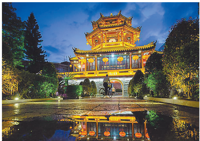
揭阳古城进贤门

当短视频时代到来，潮汕英歌舞火速出圈，到如今《给阿嬷的情书》电影的破圈，更让潮汕文化迎来厚积薄发的时刻，“镜头下的风物，终于为大众所看见。”2023年，沈绵钺拍摄的揭阳西郊顺水龙舟短视频，被新华社转发，甚至获得联合国教科文组织海外转载，超高的网络曝光度让潮汕非遗龙舟走上了世界舞台，这更让沈绵钺有了“子承父业”的荣耀。