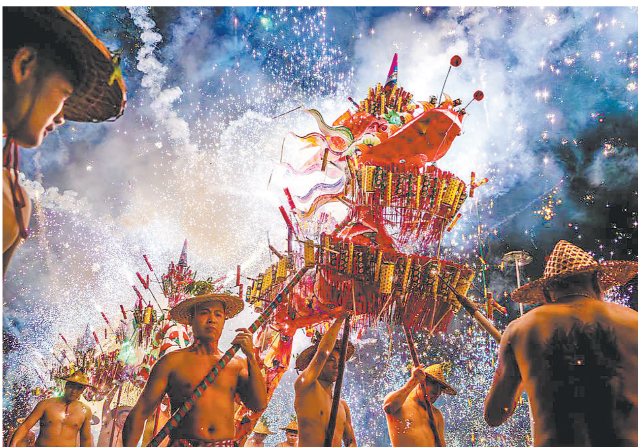
乔林烟花火龙