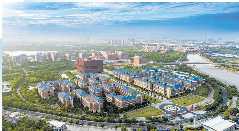
广州新华学院(东莞校区)