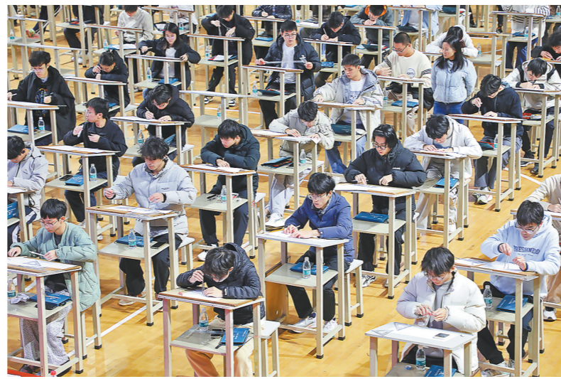
广东轻工职业技术大学学生期末开展“技能大比武”

再看地方：广东已建成全国规模最大的职业教育体系之一——全省职业院校超600所，在校生近