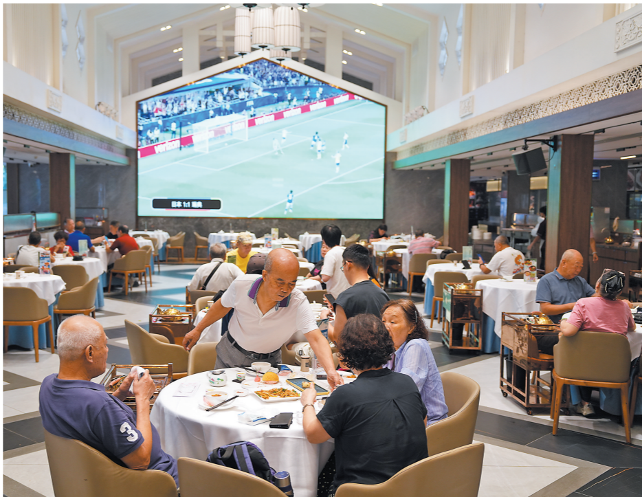
6月26日上午,广州市白云区一家茶楼的大屏幕播放着世界杯比赛,市民在大屏前喝早茶

喝早茶的酒楼”搜索量同比增长11倍,“粤式早茶”搜索量增长131%。“广州早茶排行榜”和“顺德早茶”搜索量分别增长91%和46%。