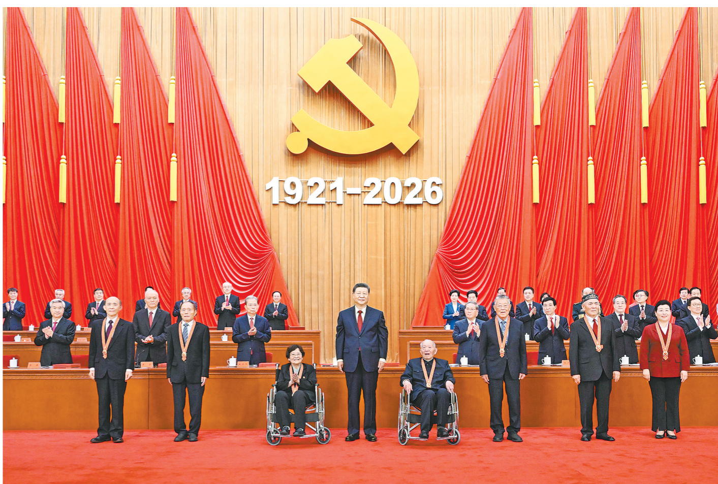
7月1日上午，庆祝中国共产党成立105周年大会在北京人民大会堂隆重举行。中共中央总书记、国家主席、中央军委主席习近平向“七一勋章”获得者颁授勋章

新华社北京7月1日电 庆祝中国共产党成立105周年大会7月1日上午在北京人民大会堂隆重举行。中共中央总书记、国家主席、中央军委主席习近平向“七一勋章”获得者颁授勋章并发表重要讲话。他强调，105年来，我们党始终坚守为中国人民谋幸福、为中华民族谋复兴的初心使命，在不懈奋斗中创造了彪炳史册的伟大成就。新征程上，全党同志要坚定信心、接续奋斗，不断创造无愧于时代和人民的新业绩。