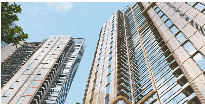
珠江·金融城·颐德公馆将在下半年入市(效果图)

一串数字的背后，是这座城市对金融城崛起的集体注视，更是公众对“什么是广州下一个封面”的深切追问。