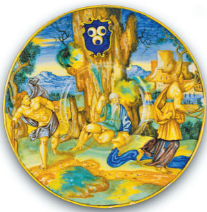
绘有阿波罗与达芙妮的陶盘 费朗切斯科·桑托·阿维利

7月1日,“文艺复兴的交响:格拉斯哥博物馆藏大师作品展”在广东省博物馆开展。提香、贝利尼领衔,意大利名师真迹集体亮相粤博。这