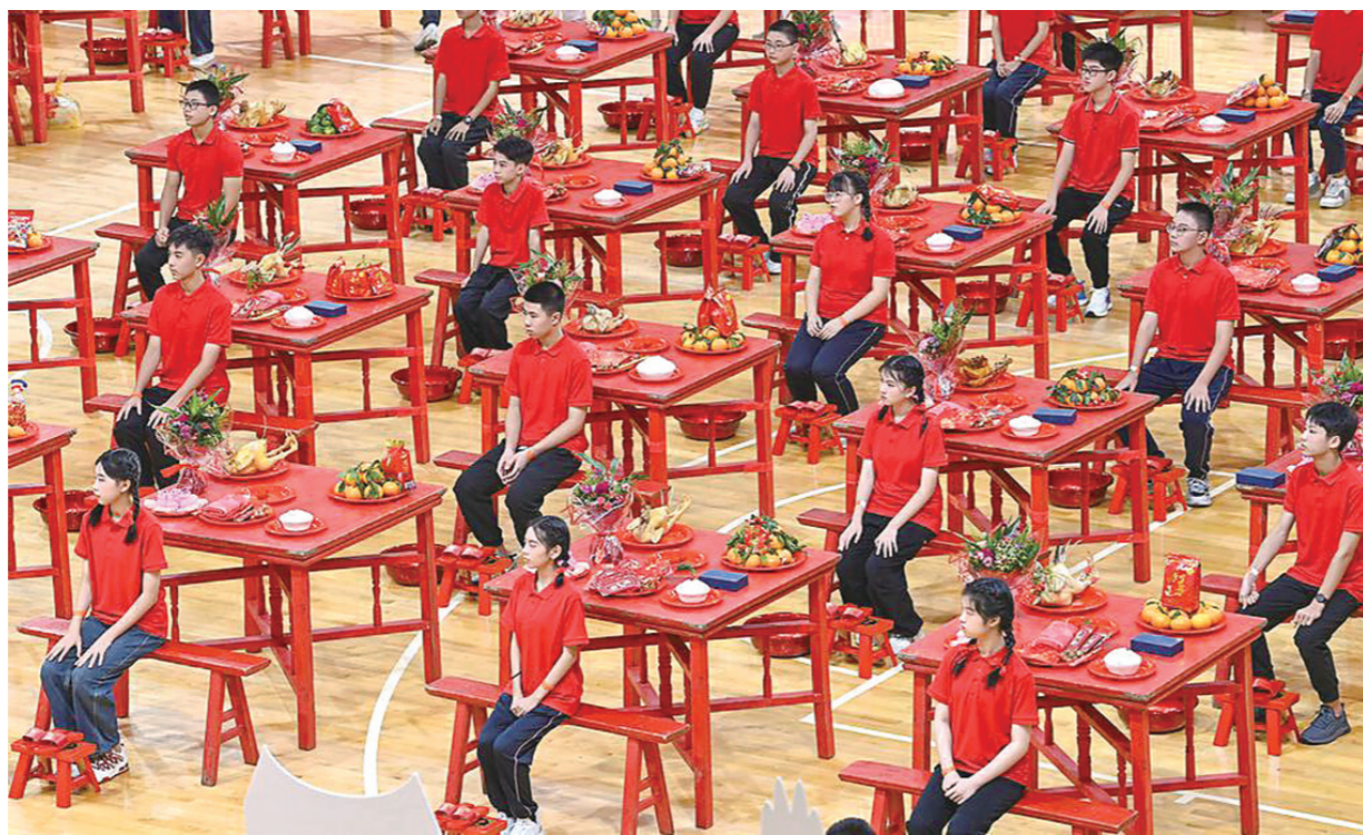
出花园活动现场(资料图片)