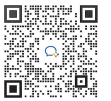
有问题问德叔团队? 扫码入群可提问

功效:益气养血。 适宜人群:产后关节疼痛、手脚冰凉等人群。 烹制方法:诸物洗净,猪排骨剁块焯净,山药去皮切段;将上述食材一同放入锅中,加适量清水,大火煮沸后转小火慢炖1小时,加入精盐调味后即可饮用,此为2或3人量。