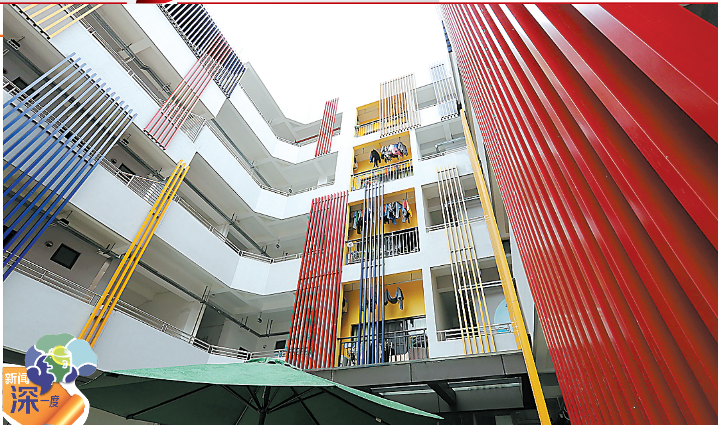
东莞长租公寓装修时尚，吸引不少年轻人入住