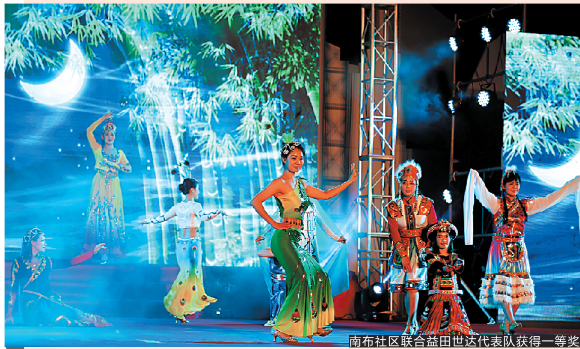
南布社区联合益田世达代表队获得一等奖

据介绍，此次系列活动旨在纪念“三八”国际劳动妇女节108周年，表达对各条战线的广大妇女同胞致以节日的问候，进一步促进坪山区精神文明建设，丰富辖区妇女同胞的精神生活，增强她们的向心力和凝聚力，彰显坪山妇女同胞积极向上的精神风貌。活动为妇女姐妹们搭建了一个很好的交流平台，通过系列互动游戏，增进彼此之间的了解，展现巾帼风采，充分释放活力，助力坪山区妇女发展的美丽事业。（胡振华 段蕊）