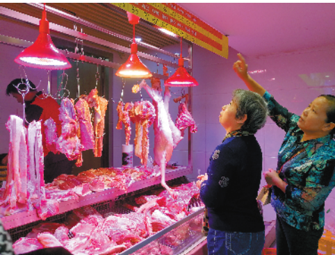
全国猪肉价格连续4周回落

加快对港澳服务业开放。深化穗港澳专业服务业合作，深入推进建筑、法律、知识产权等专业服务领域资格互认、行业标准融合。1—9月，投资总额5000万美元以上的港澳投资项目共131个，占全市5000万美元以上外资大项目的85.1%，投资项目主要涵盖新能源汽车、信息技术服务、仓储物流、电子商务等领域。