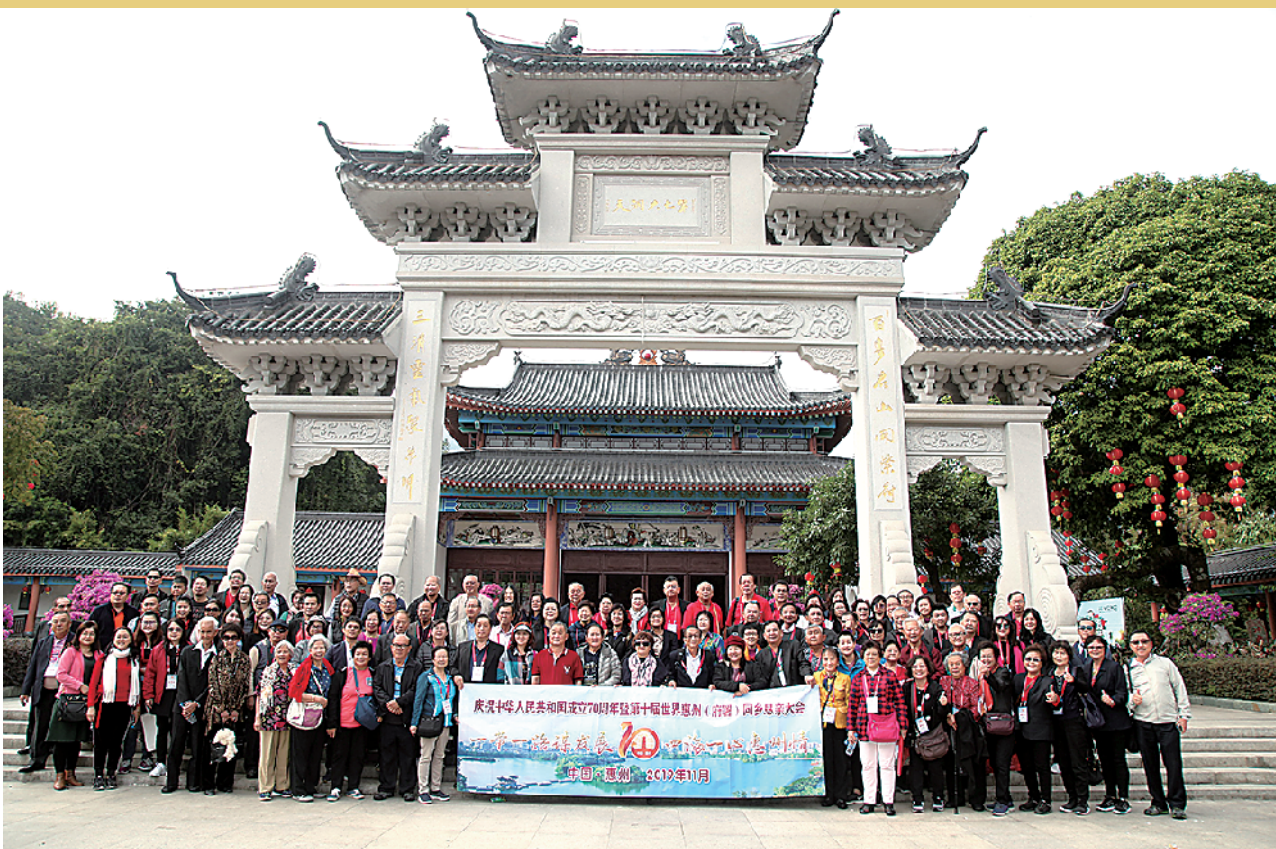
华侨代表在罗浮山合影留念

策划/统筹 羊城晚报记者 陈晓鹏 文/图 羊城晚报记者 吴大海 林海生 黄翔宇 金羊网记者 李海婵 通讯员 王旋玲