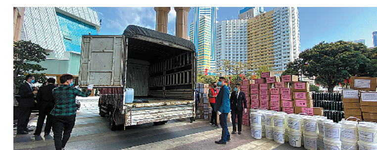
深圳饭店企业在自身经营受到严重影响的情况下踊跃捐赠物资支援前线

2月24日，由深圳市福田区非公有制经济组织、福田区企业发展服务中心、深圳市福田区企业家协会、广东省名师风采岭云等深圳饭店业协会携手会员企业“众志成城、全力驰援、抗击疫情”