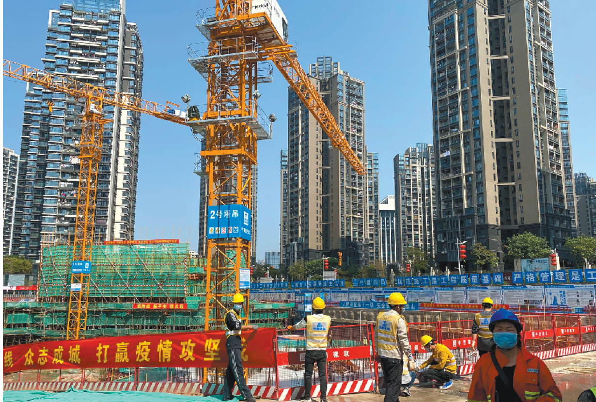
龙华人才保障项目复工