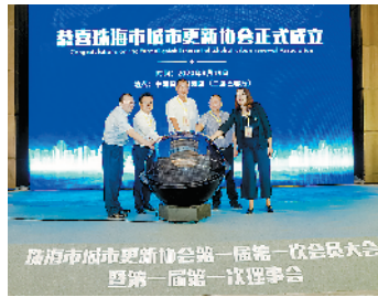
珠海城市更新协会正式成立