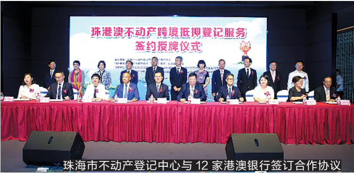
珠海市不动产登记中心与12家港澳银行签订合作协议

珠海市不动产登记中心相关负责人表示,不动产登记中心以实际行动助推粤港澳大湾区建设,着力提高港澳企业、居民办理不动产登记的便利度。在此次签约授牌仪式上,不动产登记中心与中国银行股份有限公司澳门分行等9家澳门银行、中国工商银行(亚洲)有限公司等3家香港银行现场签约授牌,珠海市不动产登记“互联网+金融服务”模式首次在香港落地,并在更多澳门银行中推广。新模式下,港澳合作银行设立珠海市不动产登记便民服务站,直接提供珠海市不动产跨境抵押登记服务。港澳企业、居民通过其办理跨境抵押登记,从“只出一次关”向“零出关”升级,从提出申请到领取证书全流程