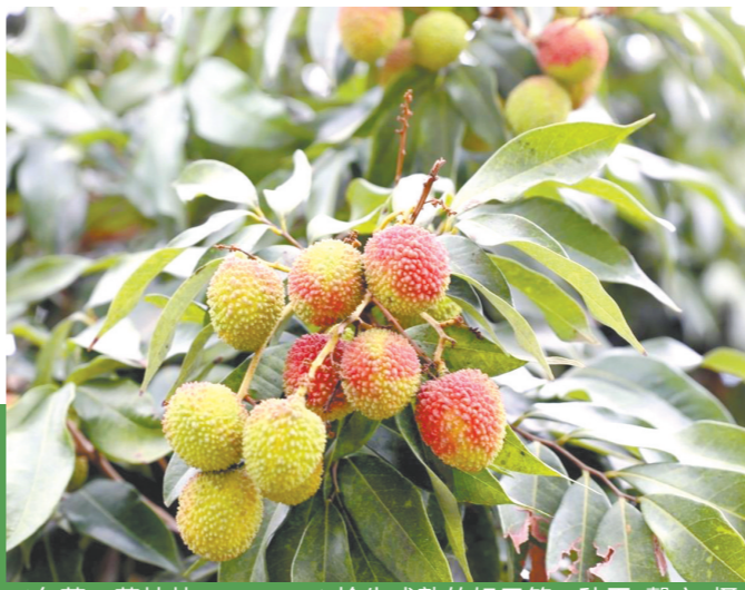
东莞一荔枝林 ▲抢先成熟的妃子笑