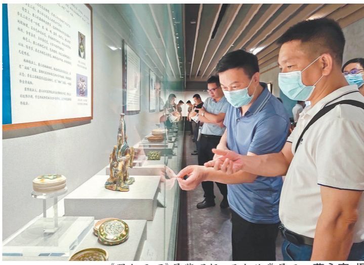
《器行天下》展览现场，观众欣赏展品

一阵惊呼引来全场的关注，原来是一把依然带有光泽的战国时期的剑，精美的纹饰仍清晰可见。根据这把剑的器型和使用痕迹等细节，汤伟健推断，应该是湖北荆门或河南信阳地区的，因为战国时期，这两处曾是大战场，极有可能会在战后留下兵器。现场有观众忍不住想去摸摸这把战国剑，却被汤