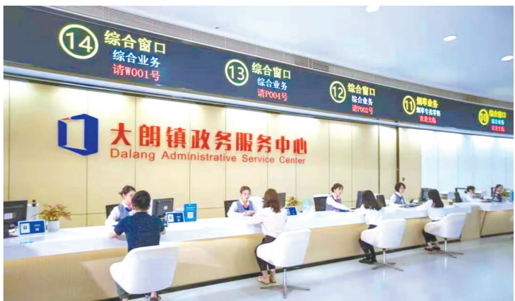
大朗镇政务服务中心设有88个办事窗口

与此同时，该中心可办理30个东莞市直部门的860项事项，办事群众在窗口提交相关资料，即可办理市级政务服务事项，有效实现“就近办”“一次办”；中心所有综合窗口皆可受理跨镇通办事项，实现社会保障、医疗卫生、生态环境、交通运输等20个大类623项政务服务事项跨镇通办。