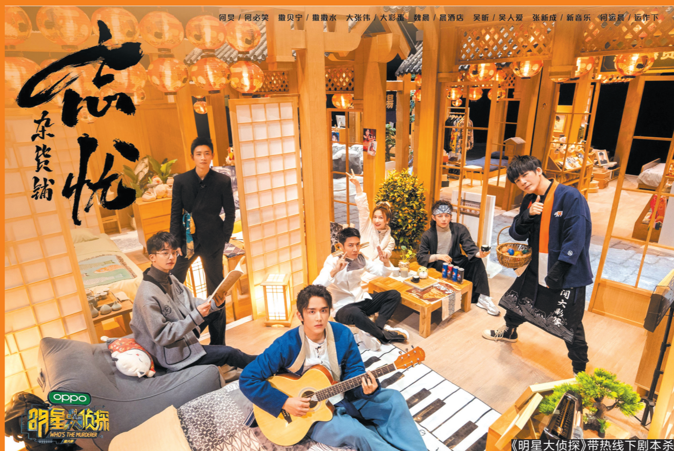
《明星大侦探》带热线下剧本杀