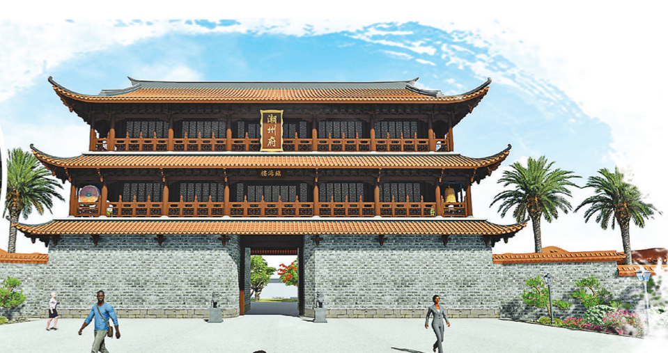
复建后的镇海楼推动潮州展现新魅力

潮州正在复建古城文化地标镇海楼，将以点带面盘活古城文旅资源，延续城市千年历史文脉，凝聚海内外潮人精神力量——