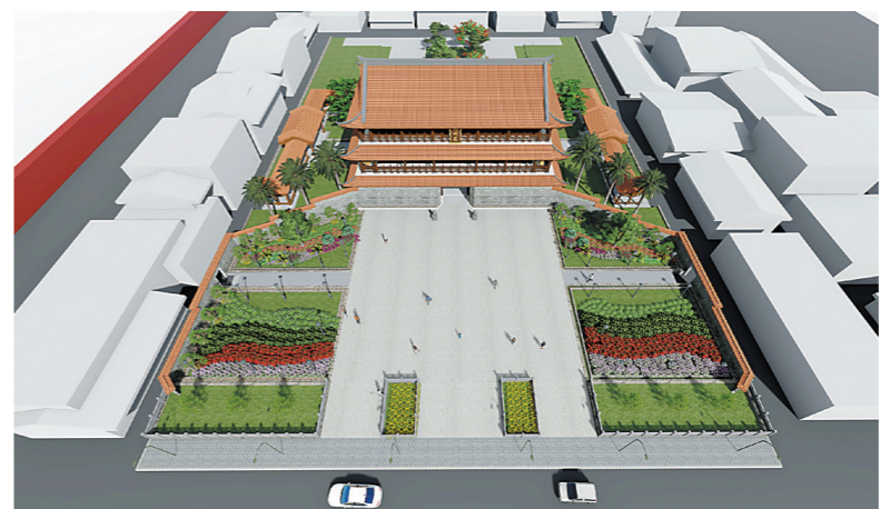
复建后的镇海楼为古城再添韵味

在统筹推进文物修缮保护工作的同时，潮州也在积极推动非遗文化的保护与传承。据悉，潮州正依托“潮汕文化(湘桥)生态保护实验区”完善规划，开展国家级文化生态保护实验区