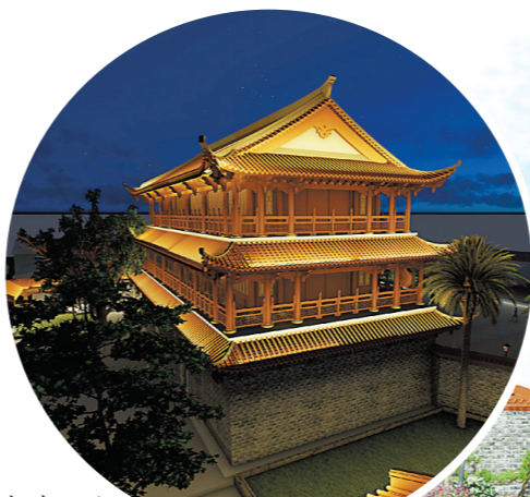
复建后的镇海楼夜景效果图

事实上，从毁于战火的无迹可寻到在原址上基本按原样复建，镇海楼(旧府衙)复建工程是潮州市深入实施古城提升行动计划的重点项目，不仅将起到“以点带面盘活古城文旅资源，推动潮州古城展现新魅力，谱写文旅融合发展新篇章”等积极作用，而且对延续城市千年历史文脉，凝聚海内外潮人精神力量，具有重要意义。