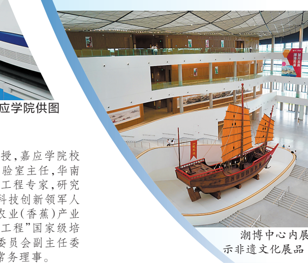
潮博中心内展示非遗文化展品

据介绍,汕头海湾隧道是国内第一座位于八度地震烈度区的超大断面海底隧道,因具有“大、高、硬、险”等特点被誉为国内“最具挑战性的最大直径盾构工程”,建成后可实现潮人自由通行汕头海湾两岸的百年梦想,为南北两岸提供一条全天候过海通道,对推动粤东经济带发展具有重要意义。