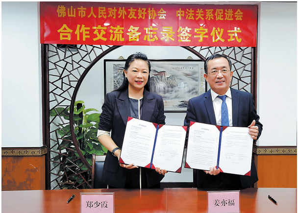
双方展示签署的合作交流备忘录