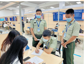
退役军人在与企业进行面谈

除了现场招聘会外，南海区退役军人事务局还通过“南海老班长”社区平台开设的“就业创业”专栏为南海老班长持续提供就业岗位、创业优惠政策，帮助退役军人了解当前就业创业形势、掌握相关政策，提高求职及创业技能。同时，结合南海老班长军创合作联盟让更多行业、企业和社会力量积极为退役军人提供就业创业服务支持，让尊崇之光照亮退役之路，确保有就业意愿和就业能力的每一位南海老班长实现成功就业和稳定就业。