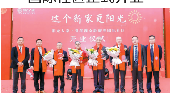
荣誉会员授牌仪式