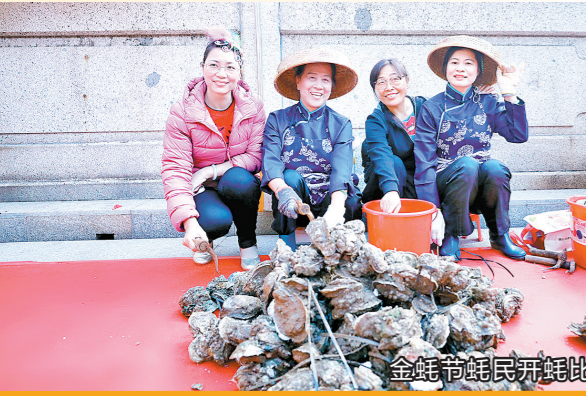
金蚝节蚝民开蚝比赛现场

当前，深圳迎来“双区”驱动、“双区”叠加、“双改”示范等重大战略机遇。作为深圳的西部中心，在前海扩区中，沙井有约15平方公里、古街道总面积2/5的范围纳入了前海新版图，独特的区位优势无可比拟，是投资创业的热土、合作共赢的宝地。未来，沙井将以民生幸福街区、更优质的营商环境，吸引更多人才落户沙井，吸引更多优质企业落户沙井，推动“西部中心、智造重镇、魅力蚝乡”跨越式发展，为“双区”建设贡献沙井力量，为宝安全面打造“世界级先进制造业、国际化湾区滨海城、高品质民生幸福城”提升知名度。