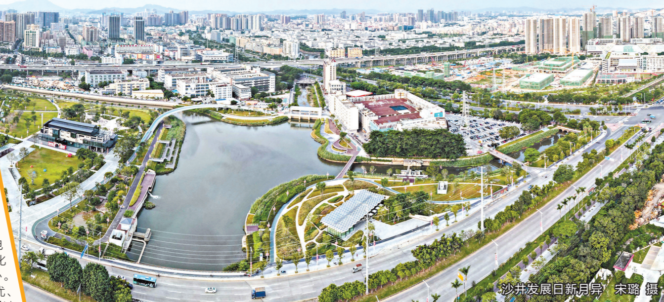
沙井发展日新月异

据悉，本届沙井金蚝节由深圳市文化广电旅游体育局、宝安区人民政府主办，宝安区文化广电旅游体育局、宝安区沙井街道办事处承办。按照“创新为先、民俗为本、文化为魂、产业为优、生态为基”的思路，营造“文化搭台、经济唱戏”浓厚氛围，与粤港澳大湾区发展机遇和深圳国际会展中心的建设有机融合，组织系列特色主题民俗文化和产业招商活动，彰显蚝文化和海洋文化特色，塑造“千年蚝乡”品牌，致力于把沙井打造成集历史文化、民俗文化、旅游、休闲娱乐、创意、经贸于一体的具有一流水平、综合性的蚝文化旅游胜地。