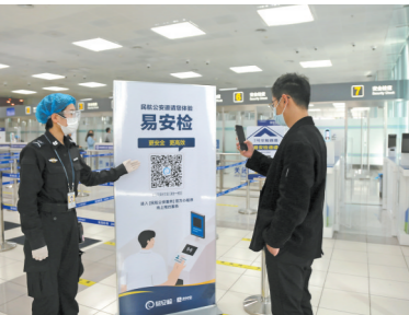
旅客扫码安装易安检小程序