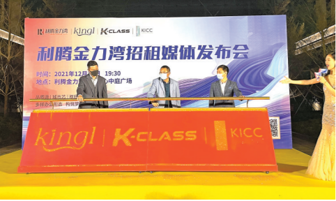
珠海利腾·金力湾商业中心揭幕仪式举行

利腾·金力湾KICC质感商务办公楼立于九洲商务区核心位置。周边配套齐全，汇聚银行、证券、商场、酒店、精致办公空间。拥有完美的配套设施、人性化的空间设计，建面150至320平方米的超大国际级、智能化的商务办公楼，是企业进驻的良地。客群相对国际化、行业丰富，与国际接轨，是全新概念的高品质商业办公区。(艾琳)