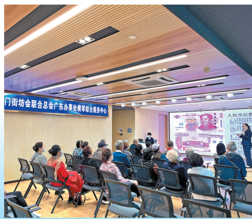
金融知识沙龙活动现场 受访者供图