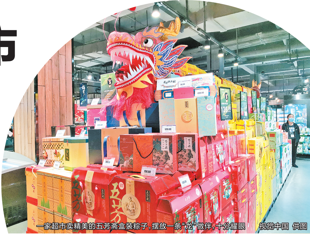
一家超市卖精美的五芳斋盒装粽子，摆放一条“龙”做伴，十分耀眼

例如，2020年端午节期间，五芳斋的咸鸭蛋广告片在B站成功“出圈”，播放量达到232.7万；2021年，发布的温情广告片《寻找李小芳》累计浏览量突破1300万。五芳斋还频频跨界，与盒马鲜生、喜茶等品牌联名推出定制粽子；并与乐事、钟薛高合作，推出咸蛋黄肉粽味薯片和粽香味雪糕。