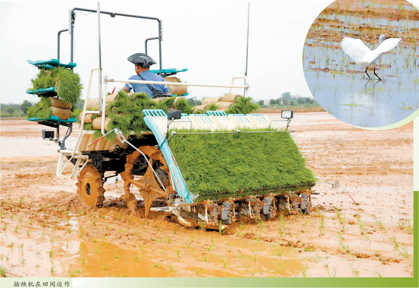
插秧机在田间运作