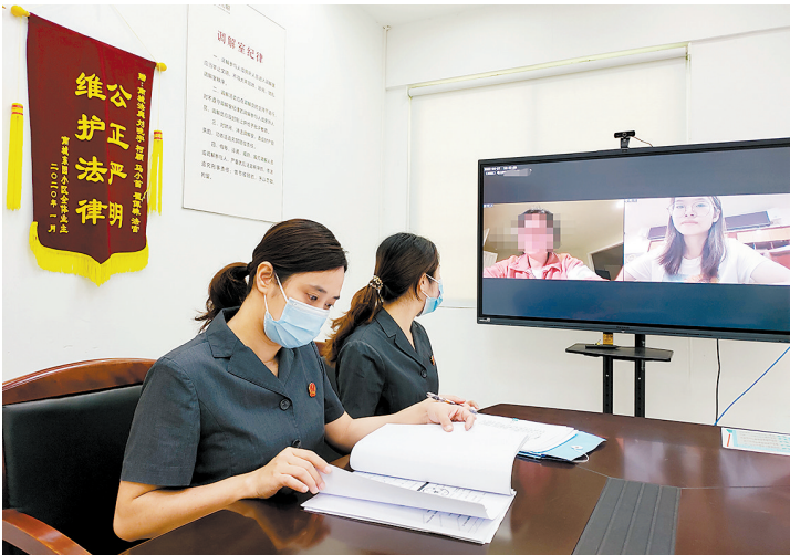
法庭云端受理跨境诉讼

据悉,按照我国民事诉讼法的规定,境外当事人委托境内律师为诉讼代理人必须办理公证认证等手续,费用高耗时长。“如果到境内公证机关办理公证或在法院见证下签署授权委托书,当事人需要来