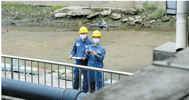
5月10日,东莞城区供电局工作人员利用无人机对江河一带排涝站进行检查

据了解,东莞供电局在本轮降雨过程开始前早已行动起来,开展防风防汛大检查工作。截至5月10日,该局累计出动检查人员798人次,对可能存在洪涝风险的4个变电站、61个配电设备、13条输电线路等开展了防风防汛大检查,开展防风防汛大检查工作,并进行限期整改。全局已组建应急队伍,包含1支特勤队、17支突击队,5支抢修协助应急队伍,38辆应急发电车常态做好突发停电快速支援及抢修复电准备,全力做好全市供电服务。同时配备好发电机、发电车、橡皮艇等应急物资,随时准备应对各类突发事件的发生。