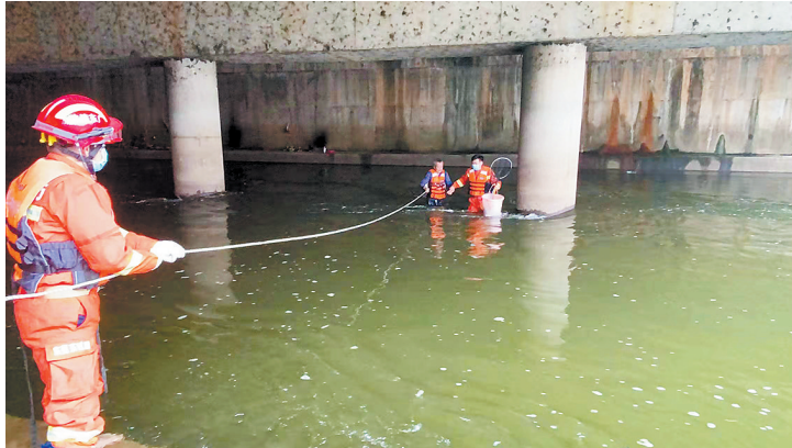
被困老人穿戴好救生衣,在安全绳和救援人员保护下走向岸边

消防救援部门提醒广大市民,暴雨来袭前要远离河道浅滩和分支流域,以免水位上涨被困。如遇突发洪水或水位上涨被困,要及时拨打119救援电话,并向地势较高的地方转移,等待救援。