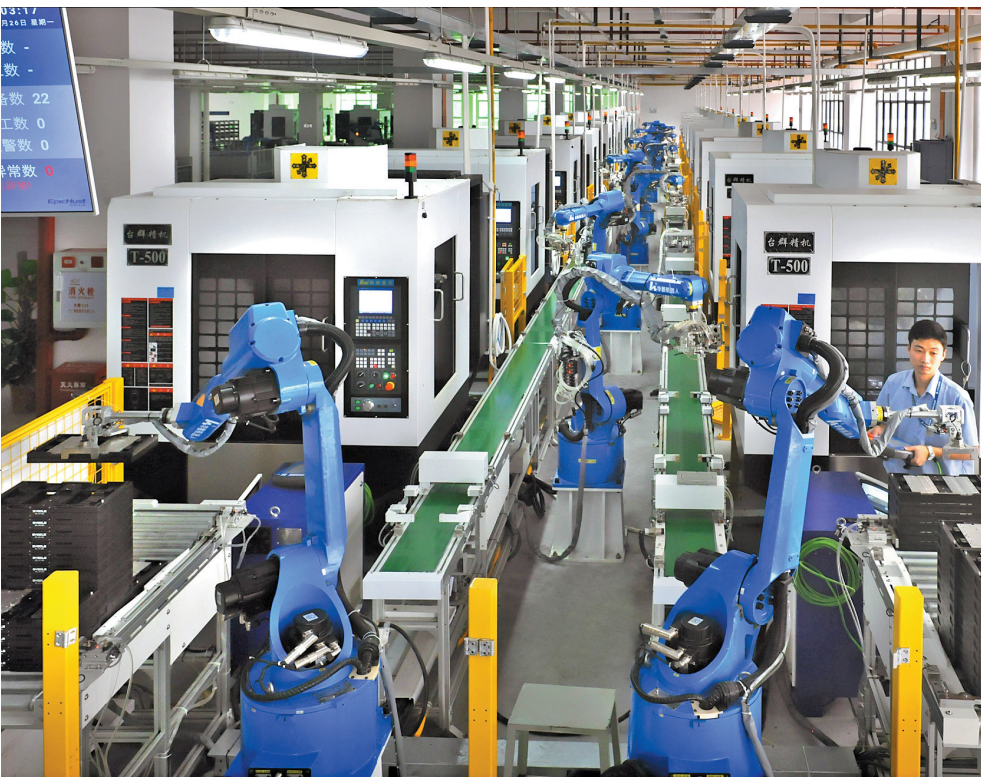
东莞各行各业对技能人才的需求非常旺盛(资料图)

将东莞打造成为全国技能人才向往之地和成长之地。立足“双万”新起点,瞄准“技能人才之都”建设新目标,2.0政策的推出无疑将是一针强心剂,助力东莞培养更多高素质技能人才、能工巧匠、大国工匠,为东莞打造大湾区先进制造业中心提供人才支撑。