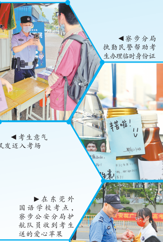
在东莞外国语学校考点，寮步公安分局护航队收到考生送的爱心苹果

连日来，公安部门作为护考的中坚力量，一直按照统一部署严阵以待，及时为有需要的考生提供帮助，确保各项安保服务举措落到实处。 8日7时30分许，在东莞厚街中学考点，一名考生向东莞交警厚街大队铁骑队员求助，称自己的身份证及准考证可能遗落在大巴车上，无法参加考试。铁骑队员获悉情况后，立即驾驶铁骑，并带着考生找到已离开的大巴车寻找，但并未找到证件。此时，其他安保警力则到考场内帮忙寻找。后经多方努力，现场警力及时在校内考生休息点处寻获遗失证件，并转交考生，帮助其顺利参加考试。 8日10时20分，东莞中学松山湖学校的考场外正下着暴雨。没带伞的考生原以为只能等雨停，这时却惊喜地发现松山湖公安分局执勤民警已经撑起伞，在帐篷外等着大家。由于没带伞的学