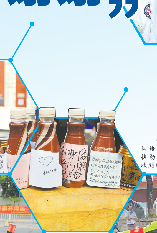
在东莞外国语学校考点，执勤民警、铁骑收到的暖心礼物

生较多，民警默默地把手伸向孩子们头顶倾斜，一趟又一趟接送，顾不上自己浑身湿透的衣裳。 8日14时许，在东莞市第六高级中学考点，一考生发现自己忘记带身份证，于是向寮步公安分局执勤民警求助。简单了解情况后，民警迅速带领考生到校门口的临时身份证明办理点，按照程序核验身份后，为考生制作了临时身份证明，考生最终顺利进入考场。 警察叔叔连日来的默默守护，让考生们备受感动，不少同学甚至送上了精心准备的礼物表达谢意。8日8时，在东莞外国语学校考点，正在学校门口执行高考安保任务的民警和铁骑收到了一份甜蜜的礼物——贴有考生亲手写满祝福语的饮料和早就准备好的苹果。考生们亲送上礼物后匆匆赶往考场，一份难却的盛情让警察叔叔的内心倍感温暖。