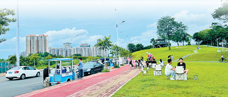
傍晚时分，摊主陆续准备出摊