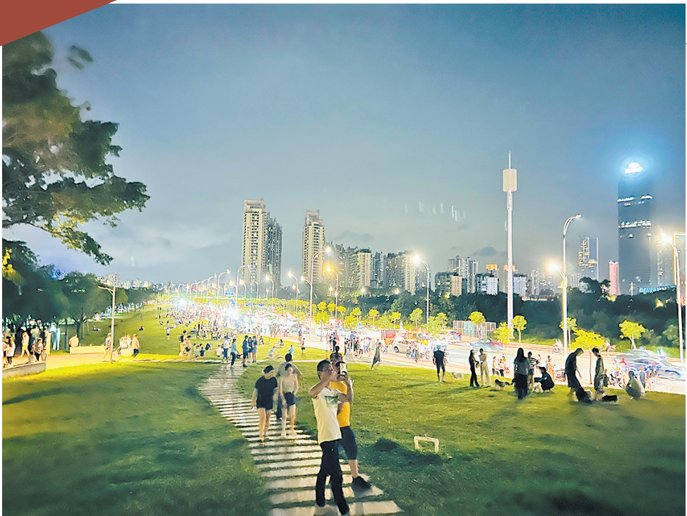
入夜后的江北大云寺江边公园