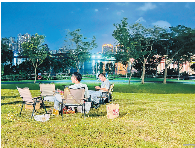
市民自带露营装备