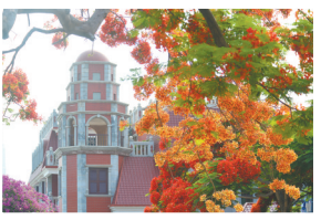
鼓浪屿钢琴码头

岭南商旅旗下广之旅也介绍，为了让应届考生用足、用好各地优惠政策，该社在设计线路及整合相关旅游资源时对有优惠的目的地景区选择有所侧重；同时，结合当地资源特点，搭配学生客群偏好的元素，如网红打卡点、小众体验、旅拍等，推出包含“金榜题名”大礼包的全新毕业游产品。这在一定程度上也刺激了毕业生的出游热情。