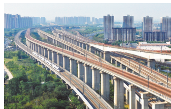
河南“米”字形高铁网

此外，京广高铁从北京至武汉这一段，今天起按时速350公里运营，新型复兴号智能动车组列车上线，从北京到武汉，旅行时间缩短到4小时以内。