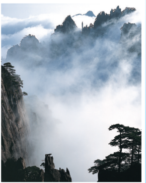
黄山云海