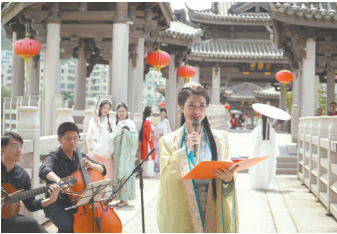
潮州是历史文化名城

今年是国家历史文化名城保护制度建立40周年。日前，住房和城乡建设部总工程师杨保军介绍，截至目前，我国有140座国家历史文化名城，799个镇村被公布为中国历史文化名镇名村，6819个村落被列入中国传统村落保护名录，形成了世界上规模最大的农耕文明遗产保护群，在快速城镇化进程中抢救和保护了一大批珍贵的文化遗产。