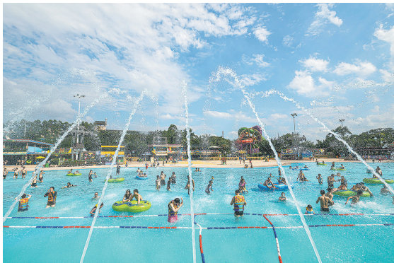
广州长隆水上乐园开园

日前，广东省文化和旅游厅也发布汛期暑期旅游安全出行提示，汛期强降雨、台风、雷暴等极端灾害天气多发频发，容易引发道路交通、山洪、泥石流、滑坡等事故灾害。提醒旅游出行看天气，极端天气不出行。