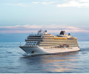
游轮线路首次成为广东省内毕业游的“可选项”，图为招商伊敦号

河南博物院、湖北省博物馆、甘肃省博物馆也是常年备受年轻学生游客关注的目的地。也有不少学生选择预订地处风景区、乡村、滨海或者代言明显IP主题的高星级酒店和品质民宿，来一趟毕业旅行放松身心。