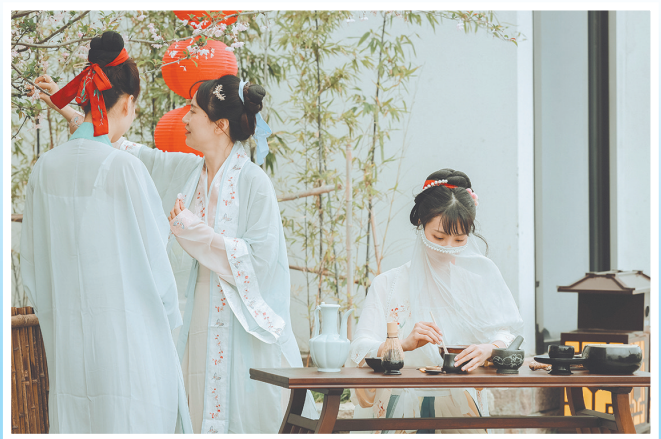
潮州世界乡村旅游小镇·国风主题活动

驴妈妈旅游网相关负责人表示，年轻的00后群体普遍具有追热点的偏好、对新鲜事物极强的接受及传播能力。像最近的新疆独库公路开放、三星堆上新等话题，他们都第一时间关注，并反映在出行的预订和消费行为中。此外，和往年相比，今年毕业季，学生在出行形式上更注重安全和私密。同学朋友之间组团自驾、精品私家团、“旅途定制”一单一团等形式受到青睐。