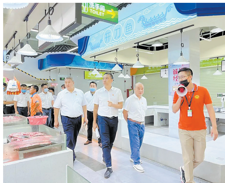
改造后的逢简市场面貌焕然一新

杏坛市场监督管理所相关负责人表示，下一阶段，杏坛将以“逢简市场升级改造”项目为标杆，加快推进其他农贸市场的升级改造工作，加强部门协同，解决市场周边“乱摆卖”问题，协助解决原有租户搬迁问题，不断提升农贸市场升级改造的参与度和群众满意度、幸福感、获得感，更好地服务辖区群众消费需求。