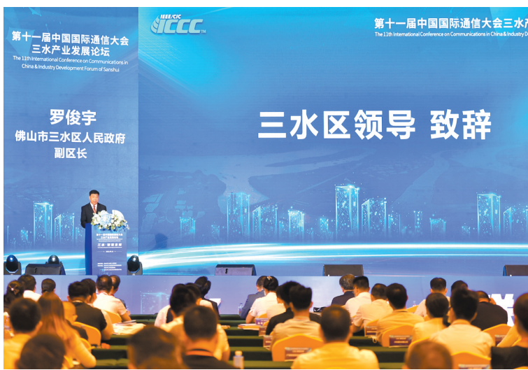
三水产业发展论坛现场

记者在现场获悉，第十一届中国国际通信大会于8月12日在佛山三水举行开幕式。大会将以“智能互联，未来通信”为主题，设有多场讲座、主题报告、主旨演讲、研讨会等形式多样的活动，中国工程院、中国通信学会、中山大学、华为等专家学者、行业企业代表将聚焦光通信与无线