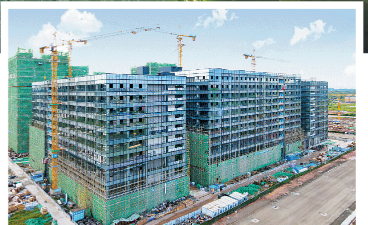
厂房还在建设中，项目早已签约