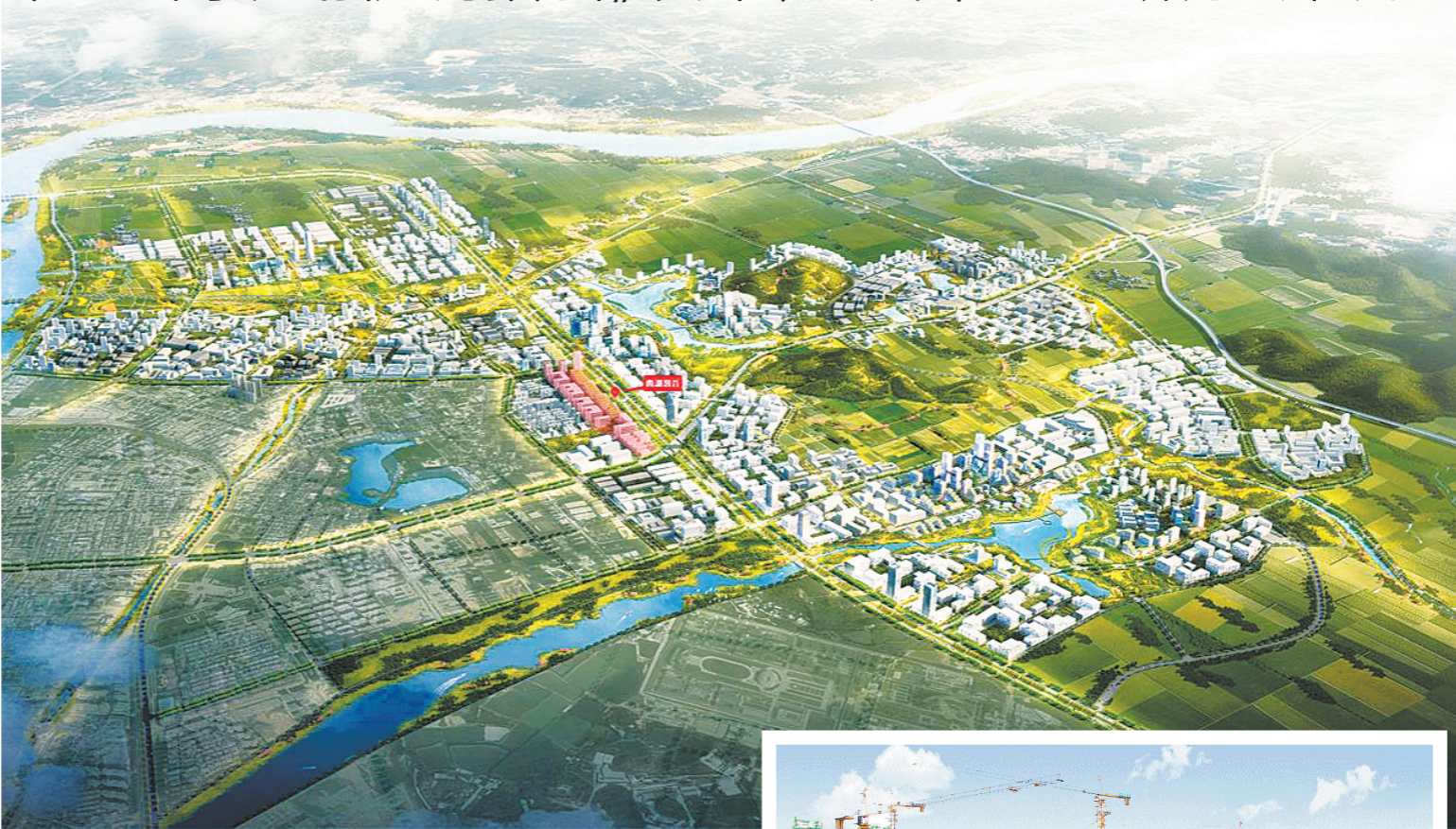
东江湾产业园规划图

惠城区只是惠州市加快融入深圳都市圈的一个缩影，今年惠州市及各县区两会，均将融入深圳都市圈作为工作重点写入政府工作报告，从产业承接、交通构建、人文互融、生活互惠等方面入手，加快与深莞接轨，协同共进。