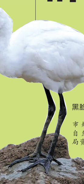
黑脸琵鹭

在大多数人的印象中，深圳是一座经济发达的现代化都市，其实深圳也是一座有着丰富多样野生动植物的生态城市。温暖湿润的气候造就这里多样而富饶的生态空间。深圳有着3万多个物种，其中陆域野生脊椎动物共计585种，其中国家Ⅰ级重点保护野生动物15种，比如小灵猫、黑脸琵鹭、中华穿山甲等，国家Ⅱ级重点保护野生动物78种；大约2086种野生维管束植物，其中，国家重点保护野生植物16种。