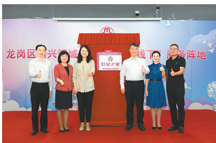
多喜娃线上“姐妹e家”和线下“妇女之家”服务阵地揭牌

目前，龙岗区在健全完善区、街道、社区三级妇联组织的基础上，实现全区机关、事业单位妇女组织全覆盖，并通过“单独创建、行业统建、区域联建、联合组建”等灵活多样的方式，推进了40余个新兴领域妇女组织的建立。成立了全市首个社会体育指导员妇联，在全市首次以“区域联建”模式，在南湾街道云创智慧城成立了全市首个区域妇联，妇联组织覆盖和工作覆盖向更深、更广领域拓展。111个社区全部建立妇女儿童之家，创建了妇女儿童之家省级示范点14个、市级示范点3个、区级示范点29个，并在新兴领域建立了“妇女之家”16个、“妇女微家”7个，初步实现“哪里有妇女，哪里就有妇女组织，哪里就有妇女工作”的目标。（李戴）