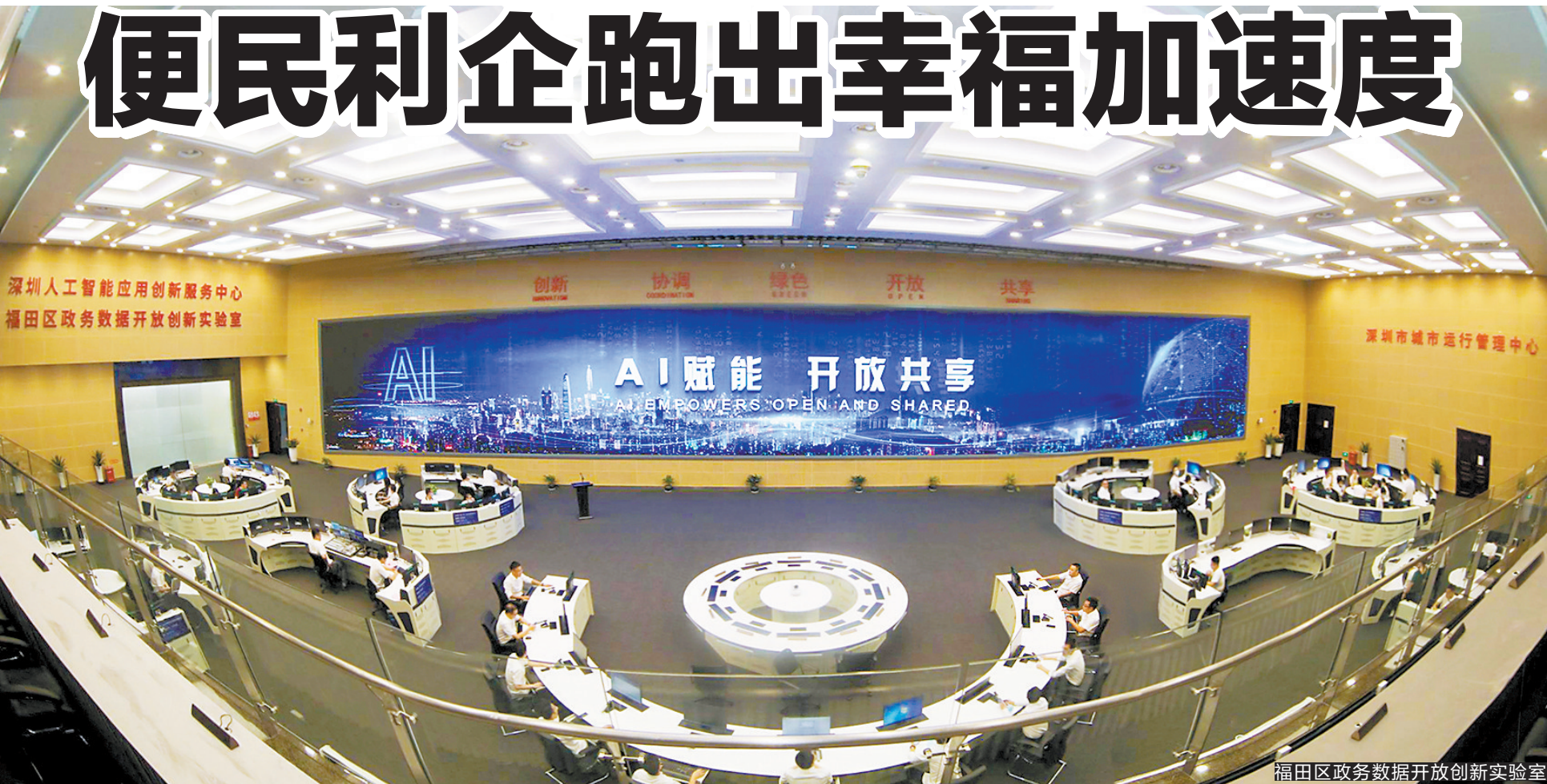
福田区政务数据开放创新实验室

争创“首善政数”，打造“福田品牌”。2022年，由国家信息中心主办的“2021亚太智慧城市发展论坛”在深圳开启。福田区政务服务数据管理局在此次论坛的“2021年度亚太智慧城市评选”中荣获“2021中国领军智慧城区”奖项。