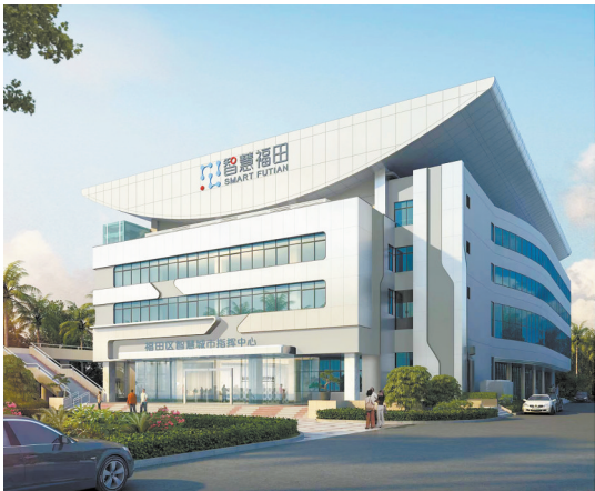
福田区智慧城市指挥中心

前瞻布局，洞察未来。福田区政数局坚持以实干促落实，以创建促提升，以科技谋创新，在硬件建设、便民举措、创建形式等方面强化攻坚、寻求突破。接下来，福田区政数局将紧紧把握创文工作标准，大力提升为民服务水平，为深圳市创建文明城市不断贡献力量。