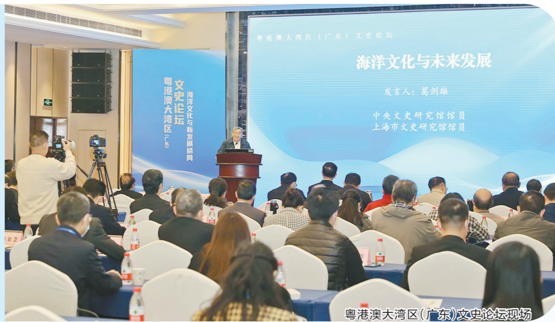
粤港澳大湾区(广东)文史论坛现场