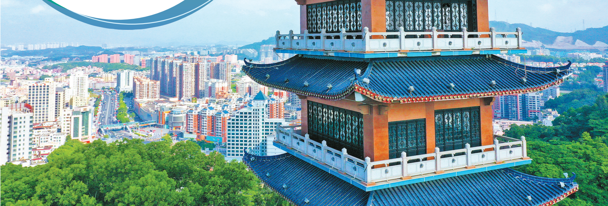
凤岗发展脚步加快，城镇景观日新月异

征程万里风正劲，重任千钧再奋蹄。东莞“理光创想”刷新凤岗重大项目落地新纪录，凤岗都市丽人智能产业项目(二期)等多个项目(总投资额逾464亿元)纳入市重大项目和重大预备项目等一系列的开局良好态势引发各方关注。3月21日，东莞市委书记肖亚非到凤岗镇开展企业经营、拓空间工作调研时，充分肯定了凤岗前一阶段的工作以及未来的谋划，并寄望凤岗在万马奔腾中力争一马当先，打造成为全面融入深圳的示范区。