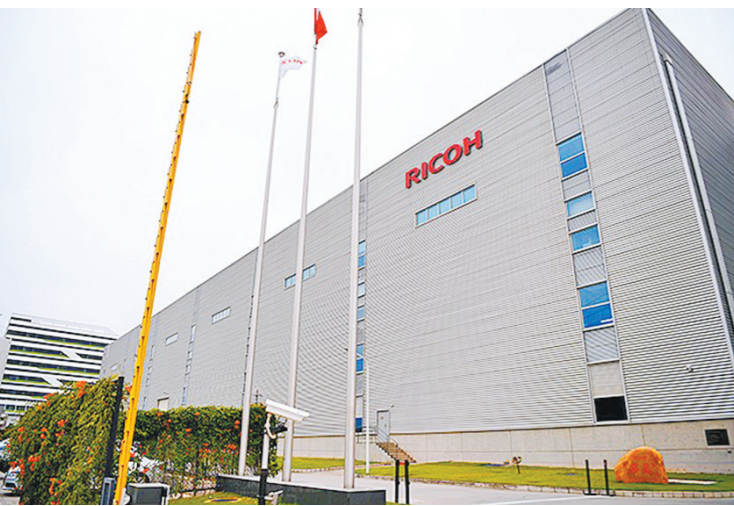
“理光创想”项目从动工到投产只用了23个月，刷新凤岗速度

根据凤岗镇“保规稳助企”专项行动方案，凤岗镇充分发挥镇主要领导、班子成员高位统筹、高效协同的优势，成立由镇委书记和镇长牵头的工作专班，制定方案和工作细则，挂点服务重点企业，“一企一案”，有效解决各类问题。争取全年新升级工业企业60家、新增市倍增企业5家、一家产值100亿元企业、国家级“小巨人”企业2家、省级专精特新企业10家。