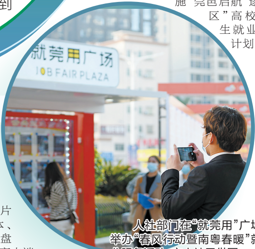
人社部门在“就莞用”广场举办“春风行动暨南粤春暖”就业服务活动

化、项目清单化、清单责任化”的“三化”要求，做到“事事有人管，件件有人抓”。三是开展分片督导，分别牵头深入推进人社效能化服务高质量发展10项重点工作任务，确保不折不扣落实省、市下达的重点指标任务，以及市领导调研的指示精神。二是对全年工作要点进行分解细化，明确年度目标、季度安排、分管领导、责任科室(单位)，落实“工作项目