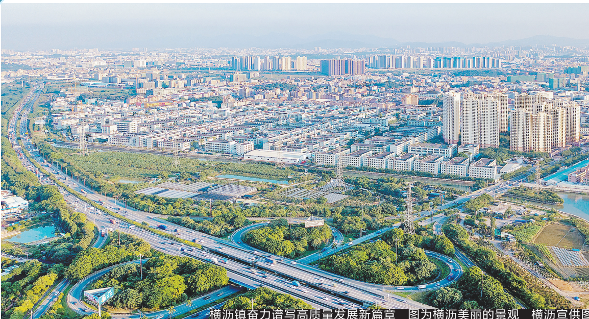
横沥镇奋力谱写高质量发展新篇章 图为横沥美丽的景观 横沥宣供图