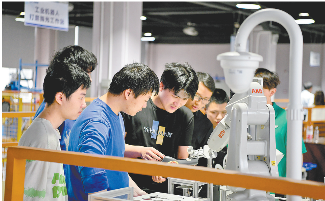
工业机器人操作培训

为加强制造业企业用工保障，2023年，市人社部门将开展“就莞用”就业用工综合服务行动，落细落实“稳工促生产”八条，成立重点企业用工保障调度专班，对重点企业实施日调度、日通报，落实清单式台账化管理，帮助企业尽快满工满产。