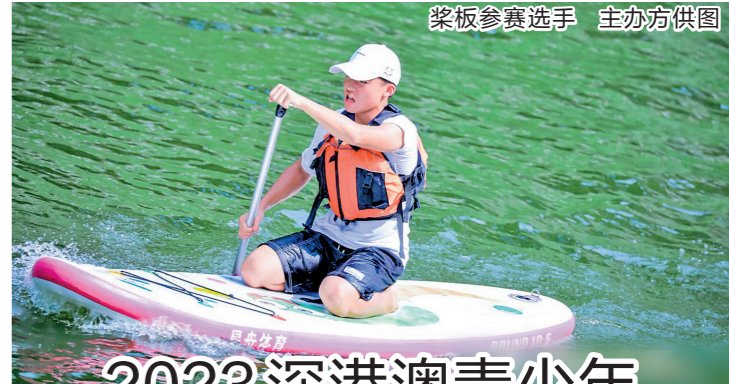
桨板参赛选手

我们助力粤桂帮扶和乡村振兴的具体举措。”深圳机场相关负责人表示,下一步,深圳机场将进一步强化责任担当、主动作为,发挥民航运输优势,为巩固拓展粤桂两地企业和产业合作、支持深圳企业到河池发展、深化各领域交流合作提供便利,更好助力特区老区优势互补、互联互通、联动发展。