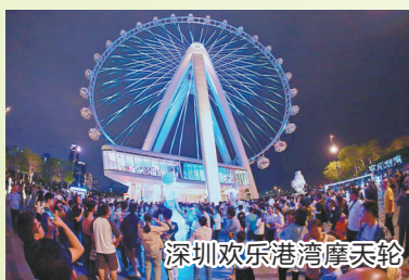
深圳欢乐港湾摩天轮

炫升级,嘻哈说唱、流行乐队、复古之夜、Kpop……十大玩啤主题轮番登场,将在世界之窗掀起超强潮流音浪。深圳市文化广电旅游体育局二级巡视员杨永群表示,深圳将持续做好“创意深圳 时尚之都”的城市旅游形象推广,利用网络平台加大宣传深圳暑期旅游产品的力度,不断放大深圳旅游的声音,扩大深圳旅游的“朋友圈”。