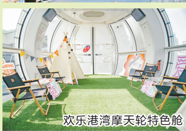
欢乐港湾摩天轮特色舱