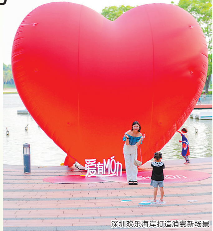
深圳欢乐海岸打造消费新场景

作为旅游活动的主要阵地,深圳各大景区正紧锣密鼓筹划精彩演出活动,积极迎接即将到来的暑期旅游旺季。今年5月,深圳景区共推出51项暑期重点活动,活动涵盖“清凉一夏、艺文一夏、夜嗨一夏、惠游一夏”四大精彩主题,营造沉浸式文旅体验,推动景区文旅融合发展。其中,深圳欢乐谷将在今年暑期联合国内知名的深圳本地IP推出全球首个“迷你世界”主题乐园——“迷你世界·冒险山”,该乐园重点围绕家庭亲子客群打造了亲子娱乐以及冒险畅玩主题区。锦绣中华打造了锦绣星光不夜城,通过32万㎡浩瀚星光灯光秀、巨型稻草人展、闪光车尾箱集市、锦绣烟火潮食集、不夜城歌舞show等一系列活动