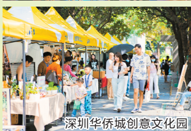
深圳华侨城创意文化园