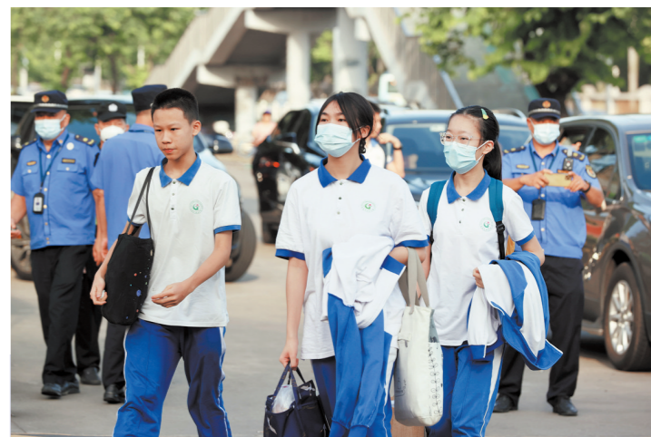
东莞中考初中部考点,生地考试结束,初二考生走出考场

高考刚刚放榜,6月26日,又有一批莘莘学子迎来一场重要考试。当日上午8时30分,随着地理(初二)学科开考铃声的响起,2023年东莞初中业水平考试(以下简称东莞中考)正式拉开帷幕,东莞市16.7万名初二、初三考生满怀憧憬奔赴考场,全力以赴书写青春答卷。