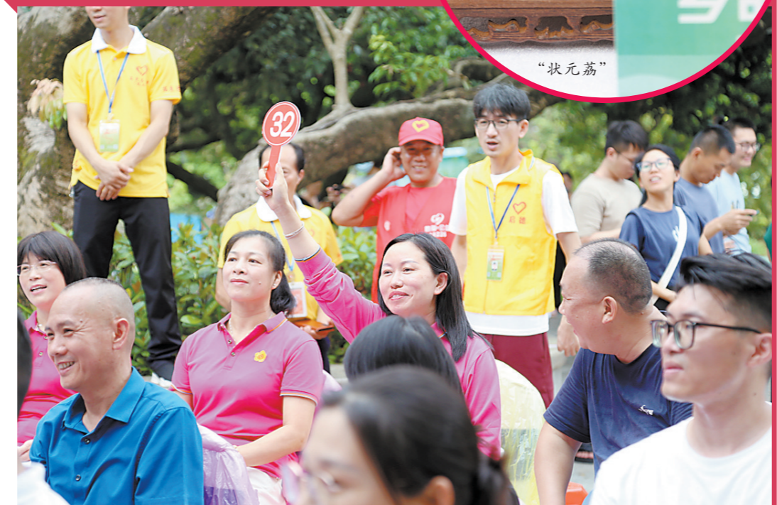
现场嘉宾参与“荔王”竞拍

“竞拍团”,现场参与“荔王”竞拍。最终,东莞市纺织纱线行业协会以22222元拍下“状元荔”100斤采摘权,东莞市骏通木业有限公司以12800元拍下“榜眼荔”糯米糍100斤采摘权(莞香荔产量不足一百斤未参与竞拍),东莞市大朗镇商店以5000元拍下“探花荔”100斤采摘权。大朗“荔王”竞拍溢价所得(除去起步价外)将全款交给大朗镇慈善会用于公益慈善事业,拍卖会由公证人员全程现场公证。 据了解,荔枝是大朗的传统水果,自宋末元初就开始种植,历史种植面积最多时达4万亩,目前也有近万亩,种植最多的分布在水平、犀牛陂、松柏岗等村(社区),其中水平村还有近两千棵荔枝古树,树龄最长超300年。2020年,大朗镇、水平村分别荣获省农业农村厅授予的“一村一品、一镇一业”荔枝专业镇、专业村称号。