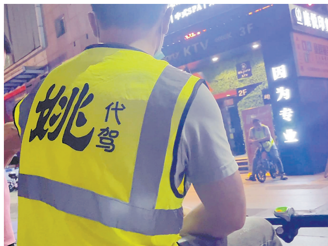
东莞东城一酒吧门口的代驾司机

45公里路程被收取1288元代驾费?1公里要价达88元?近日,多位东莞市民向羊城晚报记者爆料称“遭遇路边代驾漫天要价”。这些司机身上的马甲与市面上大家熟知的代驾品牌高度相似,主动在路边揽客,到目的地后便向车主收取高额代驾费。 连日来,羊城晚报记者暗访发现,目前东莞市场上活跃的代驾司机群体“鱼龙混杂”,一些代驾司机背后疑似无正规平台,且收费标准各异,因代驾收费问题引发的质疑声不断。