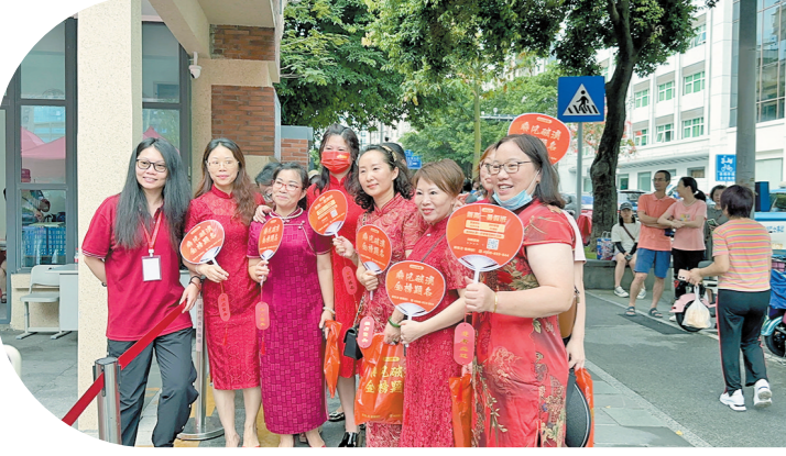
家长在校门口合影留念