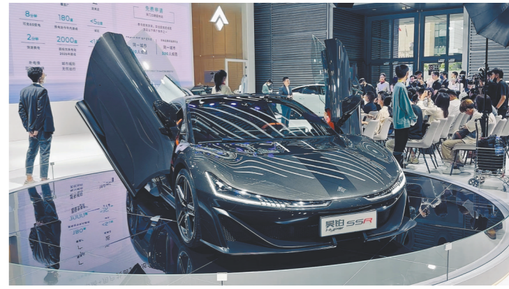
车展现场新车首发