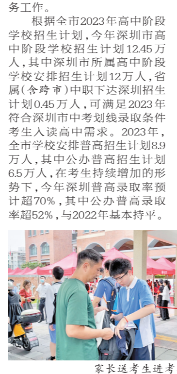
家长送考生进考场

根据全市2023年高中阶段学校招生计划，今年高中总体学位能满足计划录取考生入读需求，其中，普高录取率预计超过70%。 根据今年深圳中考中招时间安排，截至目前，中考体育考试、英语听说考试及填报志愿等工作均已顺利完成。中考文化课考试分3天进行，26日进行语文、物理与化学（合卷）考试，27日进行数学、历史与道法（合卷）考试，28日进行英语（笔试）