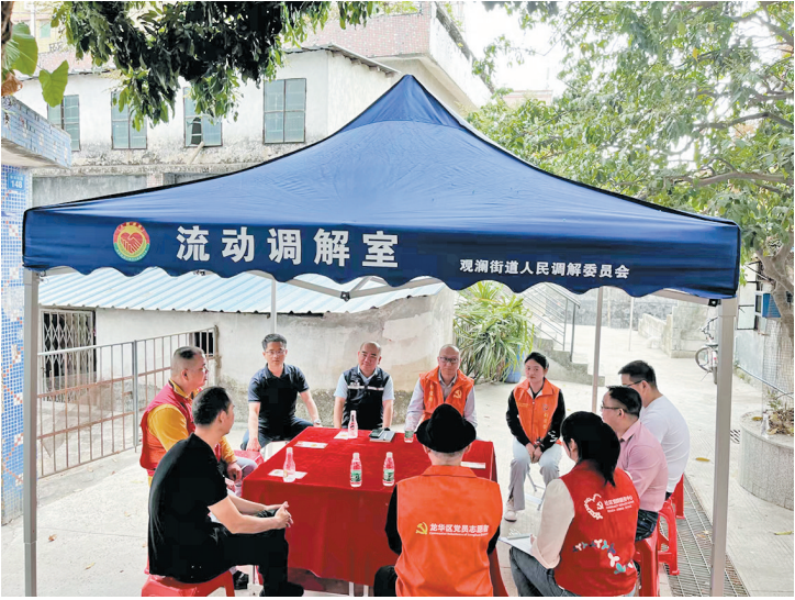
观澜街道“流动调解室”上门服务

为实现群众诉求高效处置,观澜街道持续推进“领导约见”工作机制。如本文开头一幕,街