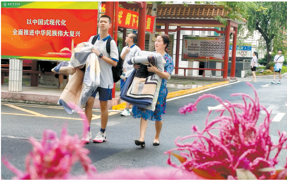
中考结束,家长接考生回家