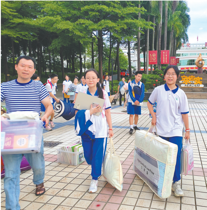
28日下午,东莞中考结束,东莞中学初中部考生打包物品回家

看了,再提前预习一下高中课程,为接下来的高中生活做好准备。 记者在采访中还了解到,初二考生的生物、地理两科相比去年难度稍有增加。据星火教育生地项目组老师介绍,本次中考生物选择题相对比较简单,基本和去年持平;但是非选择题难度较大,比往年难一些。地理整份试卷的考查覆盖面广,试题主要内容注重对基础知识和基本技能的考查,加大了对考生综合思维能力的考查力度,体现了地理学科区域性、综合性、生活性、实践性的学科特点。