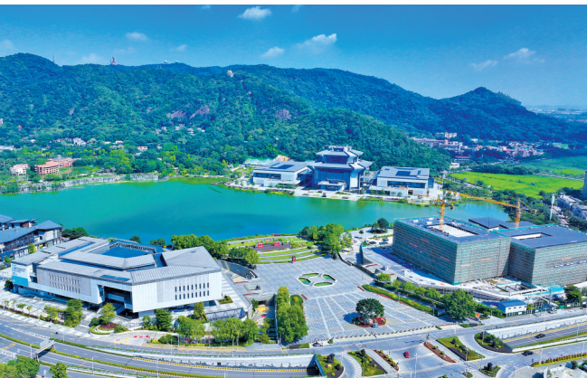
佛山西樵听音湖片区

羊城晚报讯 记者吴泳、通讯员关蕴琪报道：7月1日，印尼苏钢集团和广东懿德集团就投资佛山西樵听音湖文旅项目签订协议，未来将在西樵听音湖片区合作投资包括酒店、综合商业、工业旅游等项目，进一步为西樵文旅产业发展注入焕发新活力的“强心剂”。