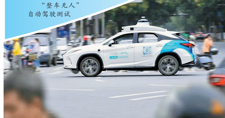
“整车无人”自动驾驶测试

作为智慧城市与智能网联汽车协同发展试点城市，2021年至今，广州、深圳同样在“真无人驾驶”政策服务、技术支持、商业化探索中大踏步前行。