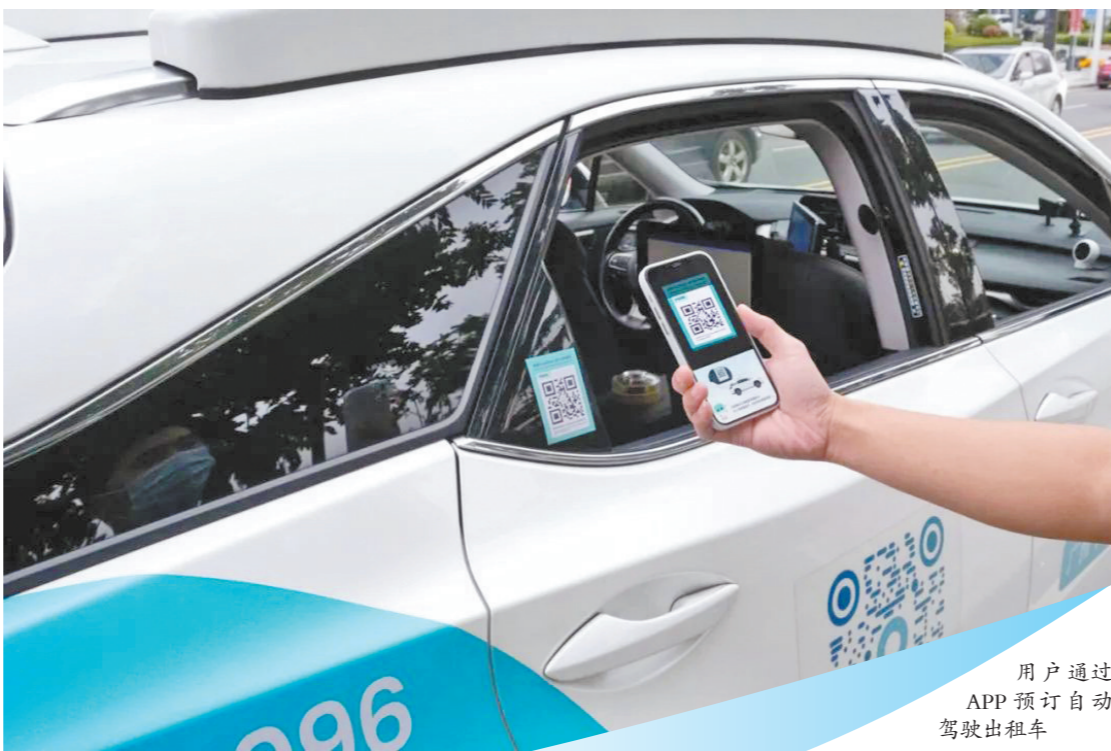
用户通过APP预订自动驾驶出租车