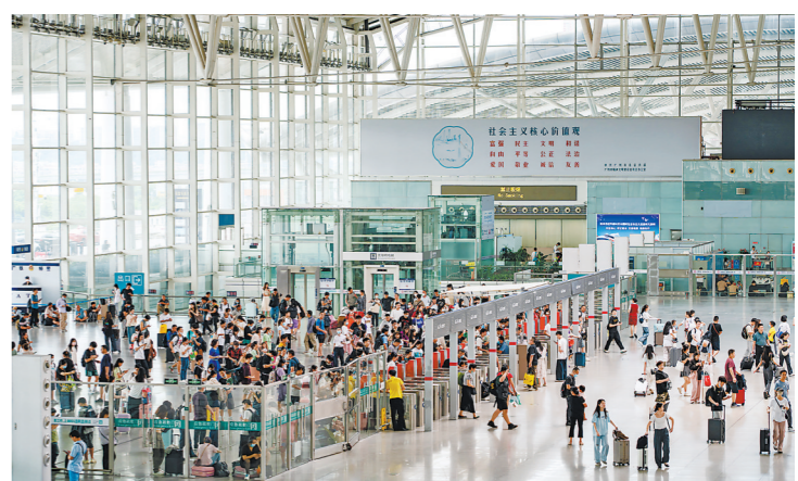
暑运期间，广州南站人头攒动

羊城晚报讯 记者李志文，通讯员刘雯、黄瑜楚报道：记者从广铁集团获悉，7月1日暑运启动以来，广铁客流持续井喷，暑运前10天(7月1日至7月10日)广铁累计发送旅客1939万人次，较2022年增加658万人次，增长51.3%；较2019年增加271万人次，增长到2019年的116.2%。其中7月8日至10日，连续3天，日均发送旅客超210万人次。