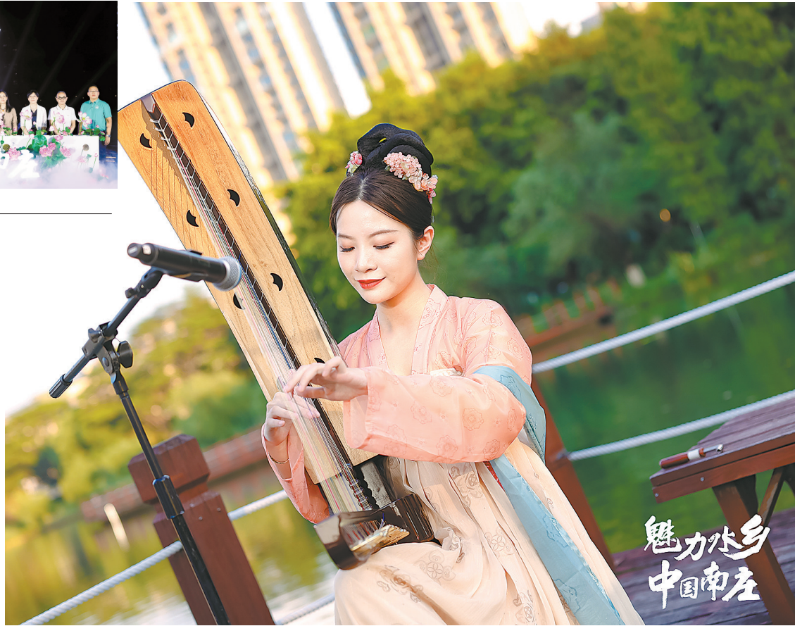
发布会现场的节目表演

都市田园风情区，展示渔歌魅力。以禅乡渔歌农业公园为核心，有着“都市田园CBD”之称，拥有山水相融、林田交错、天然野趣、乡韵悠长、鹭鸟群飞、令人向往的田园美好生活场景。