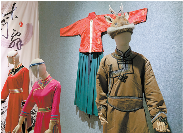
霄南村史民俗文化馆内，当地根据历史记载，参考鄂伦春族等同源民族服饰特点，复制鲜卑族服饰

据史书记载，源贺是北魏重臣，军功显赫、政绩卓著，其后人知名者众，其中源贺七世孙源乾曜更是唐朝开元年间任职时间最长的宰相。如今，霄南村建立了霄南文化广场，广场内立着一尊跃马挺枪的将军雕像，下刻“鲜卑源氏始祖源贺”，正是当地源氏族人为纪念先祖而立。