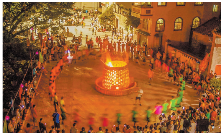
霄南村中秋舞篝火