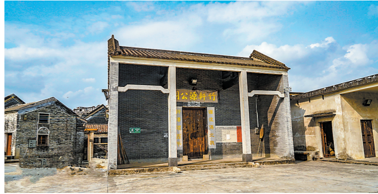
霄南村内的竹轩源祠，保留“源流传北魏，衍泽颂西平”对联