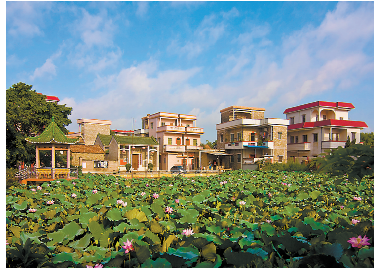
霄南村内荷叶田田，一派乡村美景