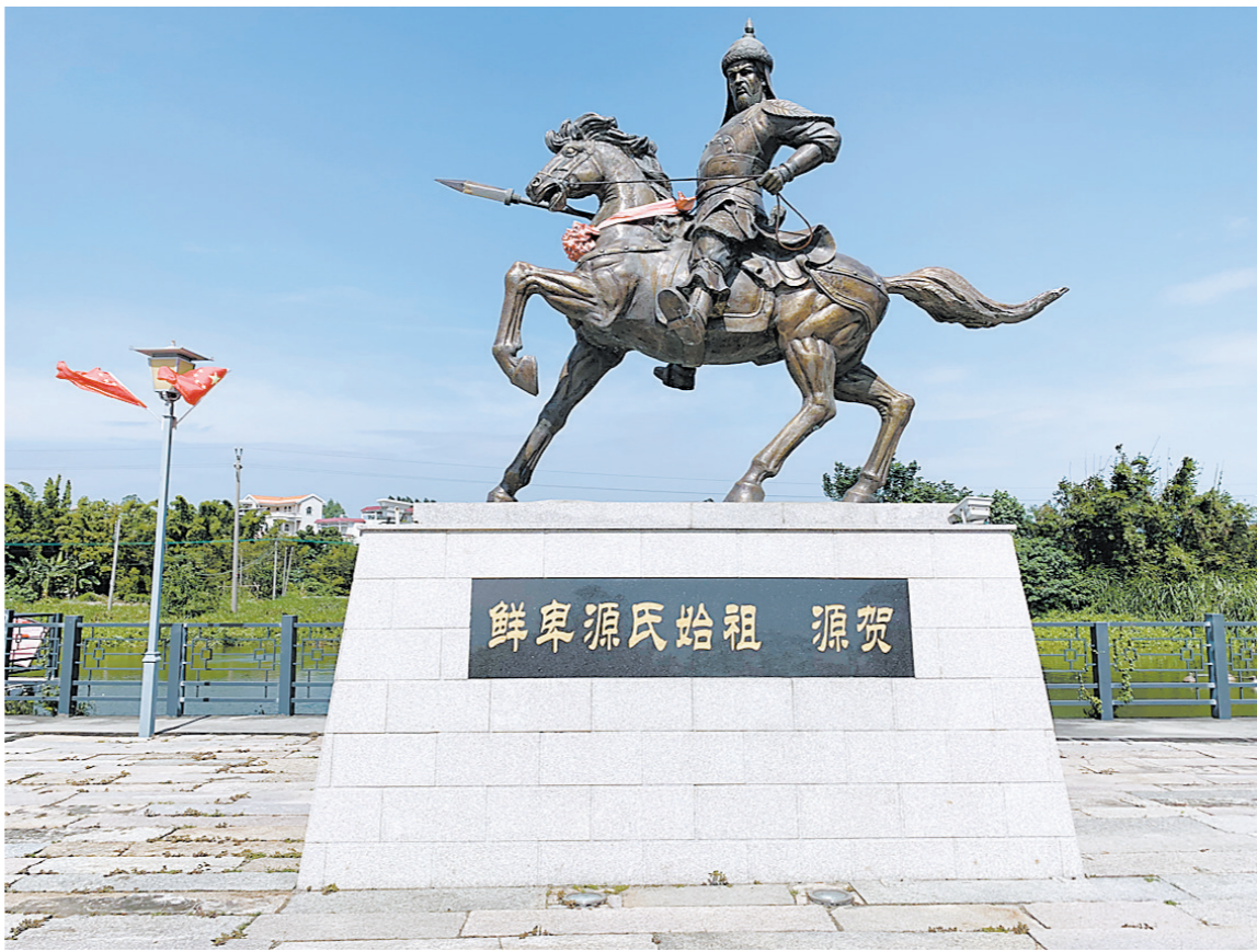
霄南文化广场内矗立的源氏铜像

从秃发到源氏，从北方到南方，从鲜卑到汉族，霄南村这个南国小村落，蕴含着厚重的民族变迁史。