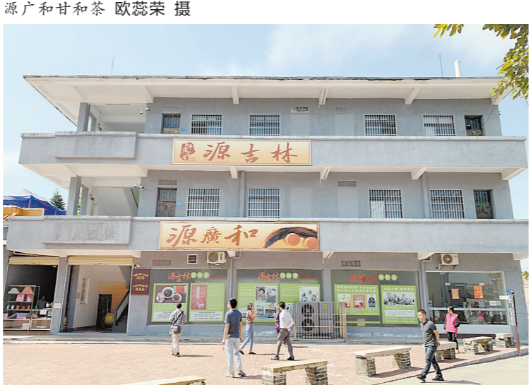
霄南村内的“源吉林甘和茶”生产基地