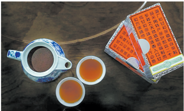
源广和甘和茶