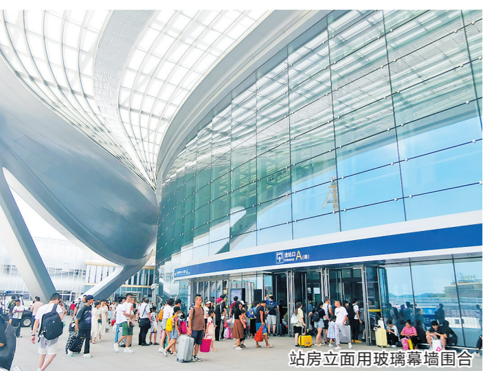
站房立面用玻璃幕墙围合

据悉，改扩建工程项目建成后，站房总建筑面积将从约15000平方米扩展到约26000平方米，高铁站候车厅面积将从现在的1500平方米扩展到约8000平方米。届时，能满足高峰期5000人次/小时的发送量。从这里登上广深港客运专线，一站可达广州南站、深圳北站(约17分钟)，四站可达香港西九龙站(约38分钟)，真正实现“1小时湾区生活圈”。