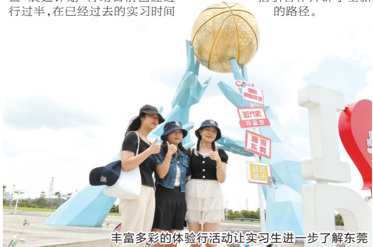
丰富多彩的体验行活动让实习生进一步了解东莞

由东莞市委、市政府和羊城晚报报业集团指导，东莞市委组织部、羊城晚报东莞全媒体传播中心、东莞市人力资源和社会保障局、共青团东莞市委、东莞市水务集团联合承办的2023年东莞市“百校千人”实习计划暨“展翅计划”行动目前已经进行过半，在已经过去的实习时间里，记者观察发现，今年的“百校千人”实习计划与2022年首届的“十校百人”实习计划相比，高学历人才尤其是博士研究生在数量上实现了倍增，各大高校与东莞市各镇街“结对子”的全新实习形式也为今后东莞市的人才招引合作开辟了全新的路径。