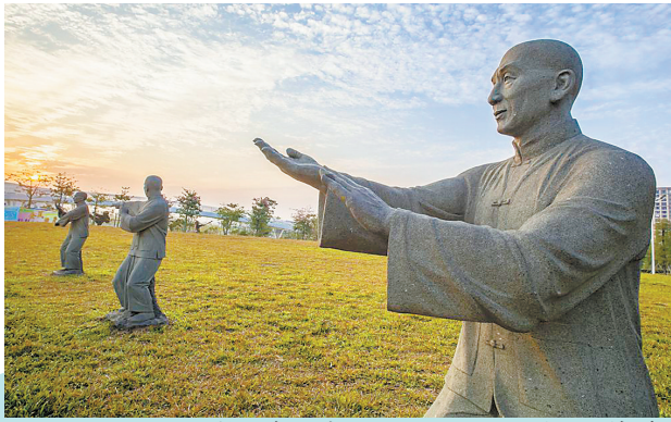
罗村咏春体育公园内的叶问石雕

在这块中国南派武术集大成之地,五大拳种交相辉映,南粤江湖风起云涌。若你想了解黄飞鸿的无影脚有多快,叶问的咏春三板斧有多猛,李小龙为何会创出截拳道,不妨走进这片江湖,细细品味佛山这座功夫之城。