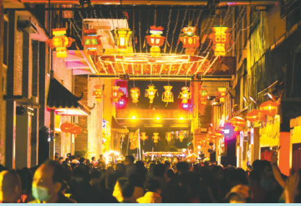
游朱紫活动

“石湾瓦,甲天下”,说的不仅是南国陶都的过去,更是它的现在和未来。从明朝正德年间至今,这里的窑火生生不息,即便历经风雨,石湾依然因陶瓷而兴盛。百闻不如一见,不如走进“典籍中的美陶湾”,看看南国陶都的前世今生。