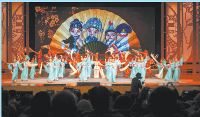
平洲粤剧的少年们

“未有八和,先有吉庆,未有吉庆,先有琼花。”在这片土地上,数百年来粤韵悠悠,“南国红豆”们在这里根深叶茂、闪耀夺目。这些曾经红极一时的粤剧“顶流”究竟有着怎样的魅力?不妨跟随我们的步伐,翻看背后尘封的故事。