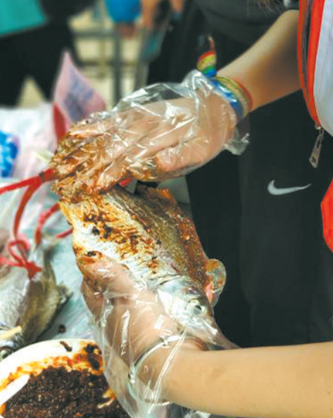
酱鱼上酱过程

桑基鱼塘、岭南风韵、人间正道、厨出凤城……这些在千年历史长河中提炼出的文化宝藏,正闪烁着光芒,引着大众将目光投射在这片大地上,总有一块“宝石”能让你陶醉在佛山风情中。