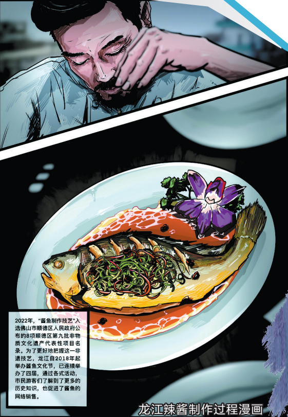
龙江辣酱制作过程漫画