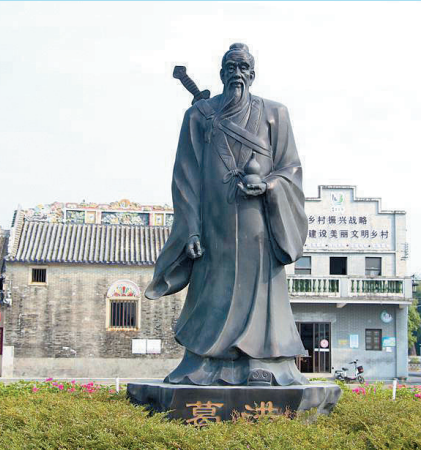
南海区丹灶镇仙岗村内的葛洪雕像

医武同源,无论是武林高手还是红船子弟,“讨江湖”的过程中受伤在所难免,以此观之,“成药之乡”佛山曾“药铺多过米铺”便不足为奇了。