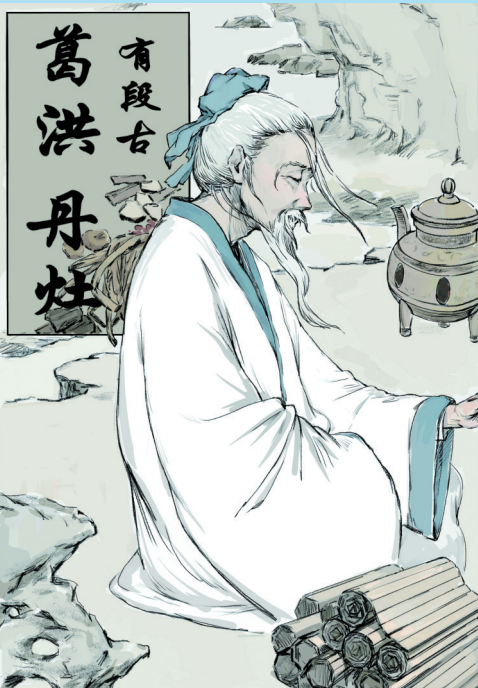
葛洪漫画“岭南医药开山之祖”