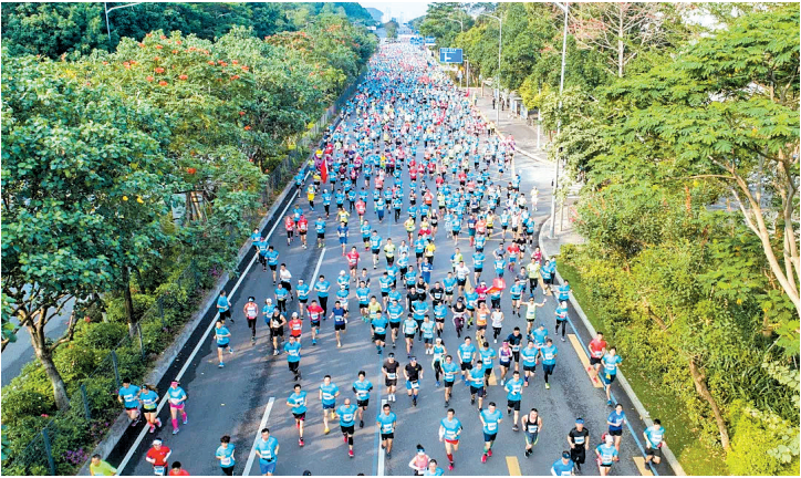
往届龙岗半程马拉松(资料图)