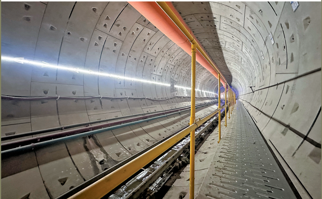
深圳地铁13号线北延工程隧道内景

羊城晚报讯 记者宋王群,通讯员欧怡君、刘扬摄影报道: 日前,深圳地铁13号线二期(北延)工程风井B-风井A右线隧道顺利贯通,标志着全线提前实现洞通里程碑节点目标,成为深圳地铁四期调整工程中率先完成洞通的线路。