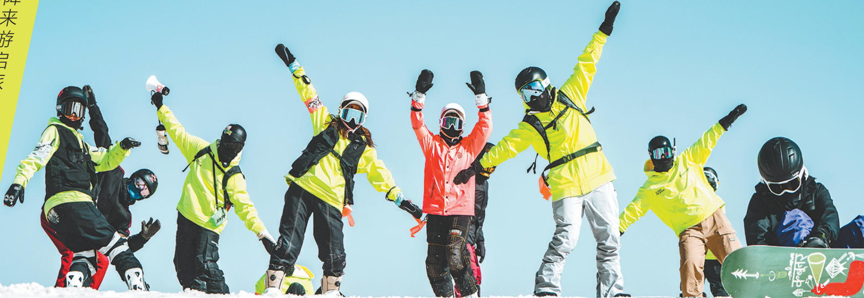
深圳深雪滑雪俱乐部组织学友在崇礼滑雪

随着我国北方地区陆续迎来大范围降雪降温，近三年多来首个完整的冰雪旅游季从本月起正式启幕。综合多家在线旅游平台统计显示，2023—2024冰雪季居民的出游热情更胜以往，预计冰雪出游人次及旅游消费将迎来爆发式增长，各类“冰雪+”花式玩法，正在引领新的文旅消费风潮。