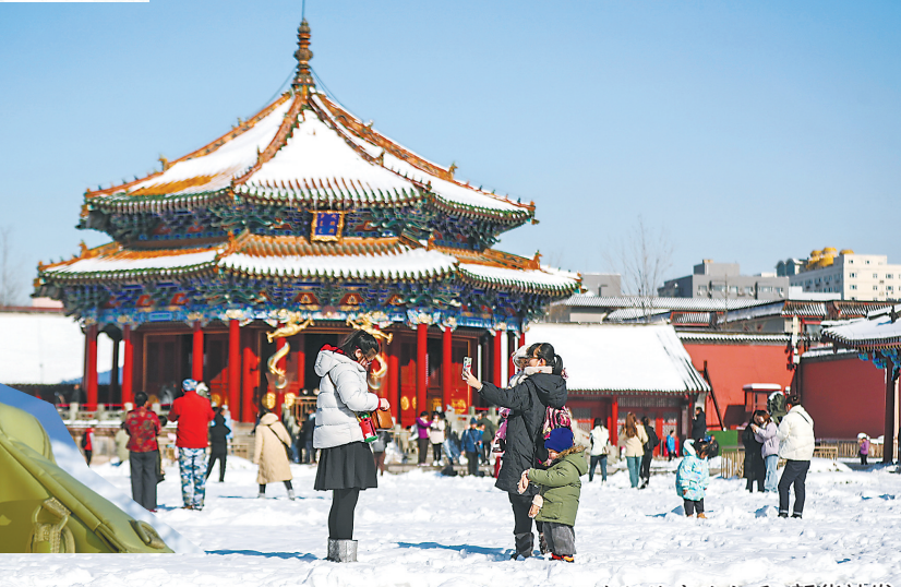
沈阳故宫迎初雪 新华社发