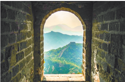
八达岭长城内外的苍翠林海

据了解，这段长城属于已公布的第一批国家级长城重要点段——明长城八达岭段，位于延庆区八达岭镇境内，属全国重点文物保护单位。