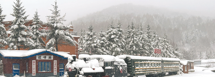
雪后黑龙江雪乡