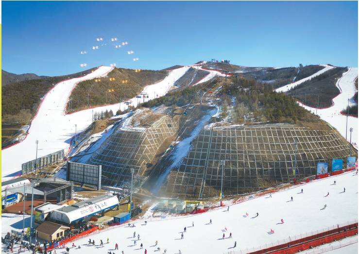
张家口崇礼密苑云顶滑雪场

冰雪游的多元化演变，一定程度上受年轻群体的带动。据悉，自2022年北京冬奥会以来，冰雪游群体的年轻化趋势增强。90后、00后成为冰雪游的消费主力，预订订单占比达六成，尤其是冰雪运动产品更加受年轻用户、青少年及亲子客群青睐。