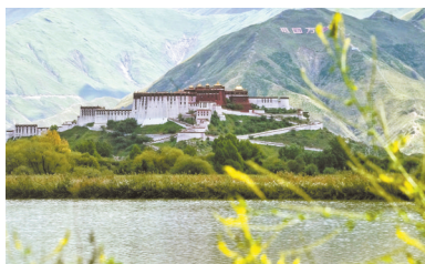
在拉鲁湿地远眺布达拉宫 资料图

11月起，全国多个知名景区免费开放。其中，西藏布达拉宫在2023年11月1日至2024年3月15日期间执行第六轮“冬游西藏”活动政策，实行免费预定、免费参观，以及错峰、限流、预约制。参观时间调整为上午9:30—下午3:20。游客可提前十天登录“布达拉宫票务预订系统”微信小程序预约门票。