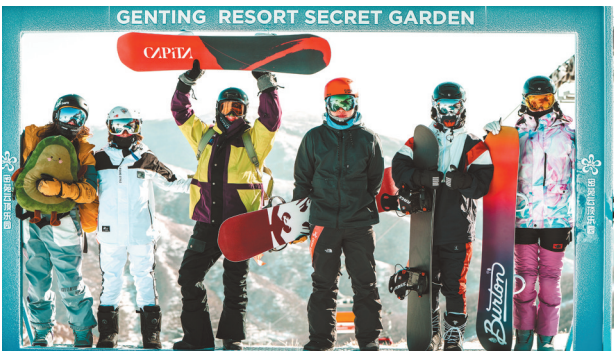
深圳雪友在崇礼滑雪

正如鲲鹏汇(北京)体育发展有限公司联合创始人法比奥·里斯所说，我国目前正处于发展滑雪和度假非常有利的阶段。除了开发技术产品之外，通过利用一些特色网红打卡地、利用建筑物的表达以及与当地文化和环境相吻合的民俗活动、赛事、演出等，还可围绕冰雪旅游做各种不同的文化和自然故事的挖掘、整合与讲述。