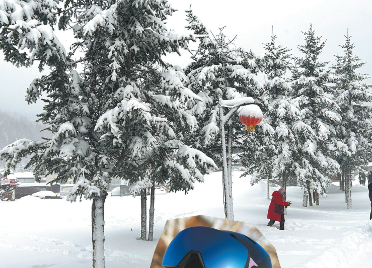
雪后黑龙江雪乡